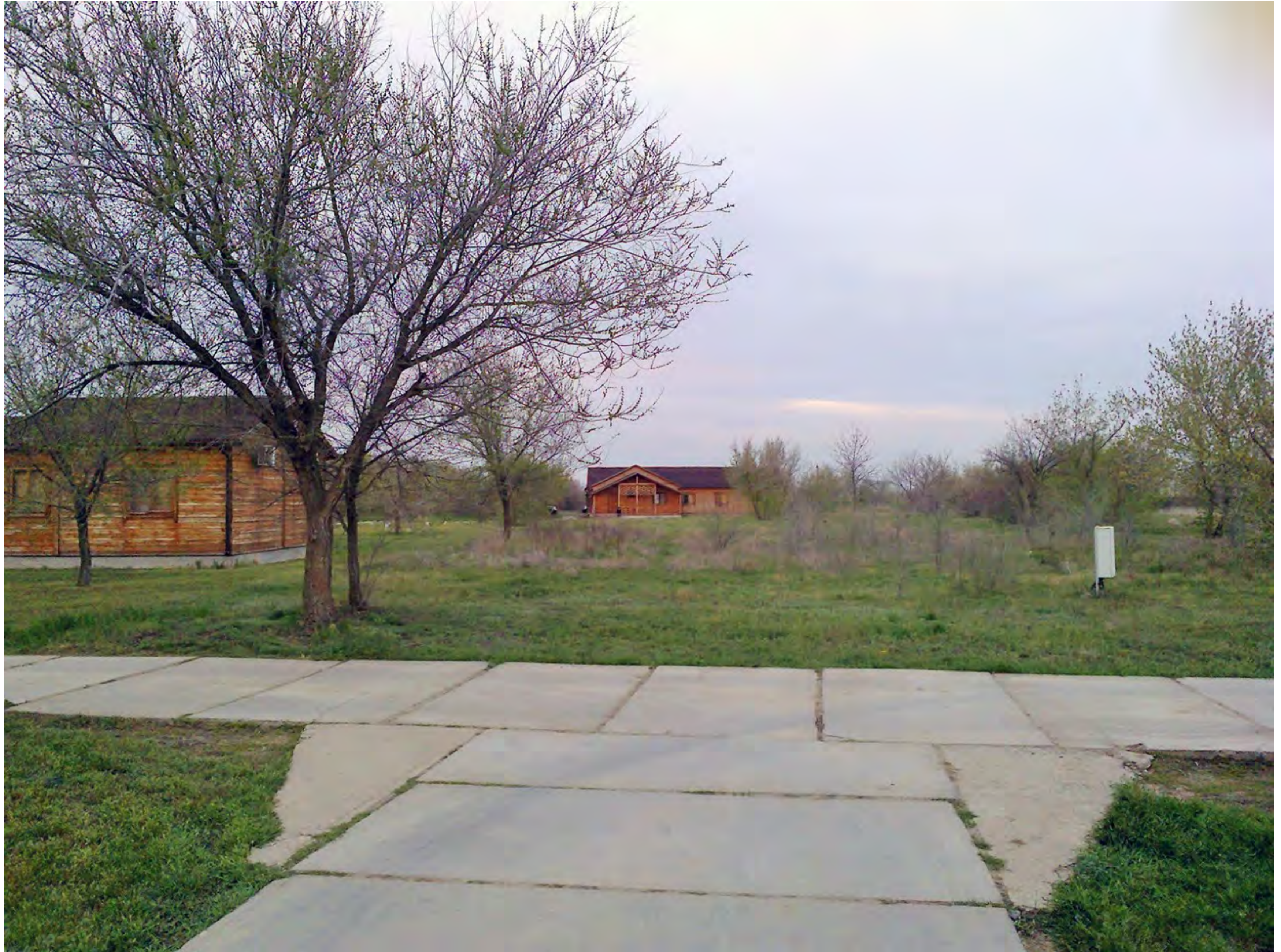
Пустого места на базе было много