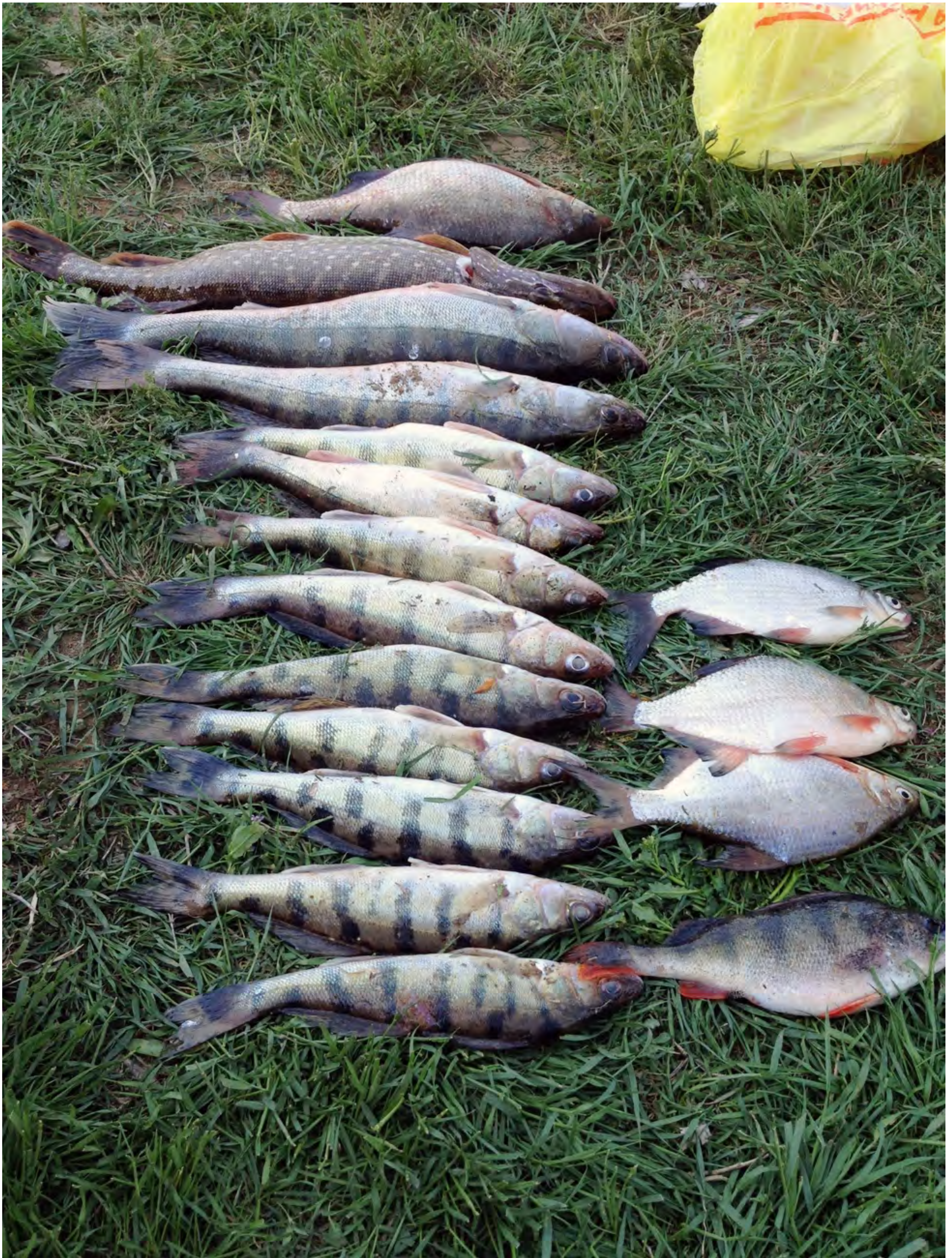
Отец с сыном немного "побраконьерничали"