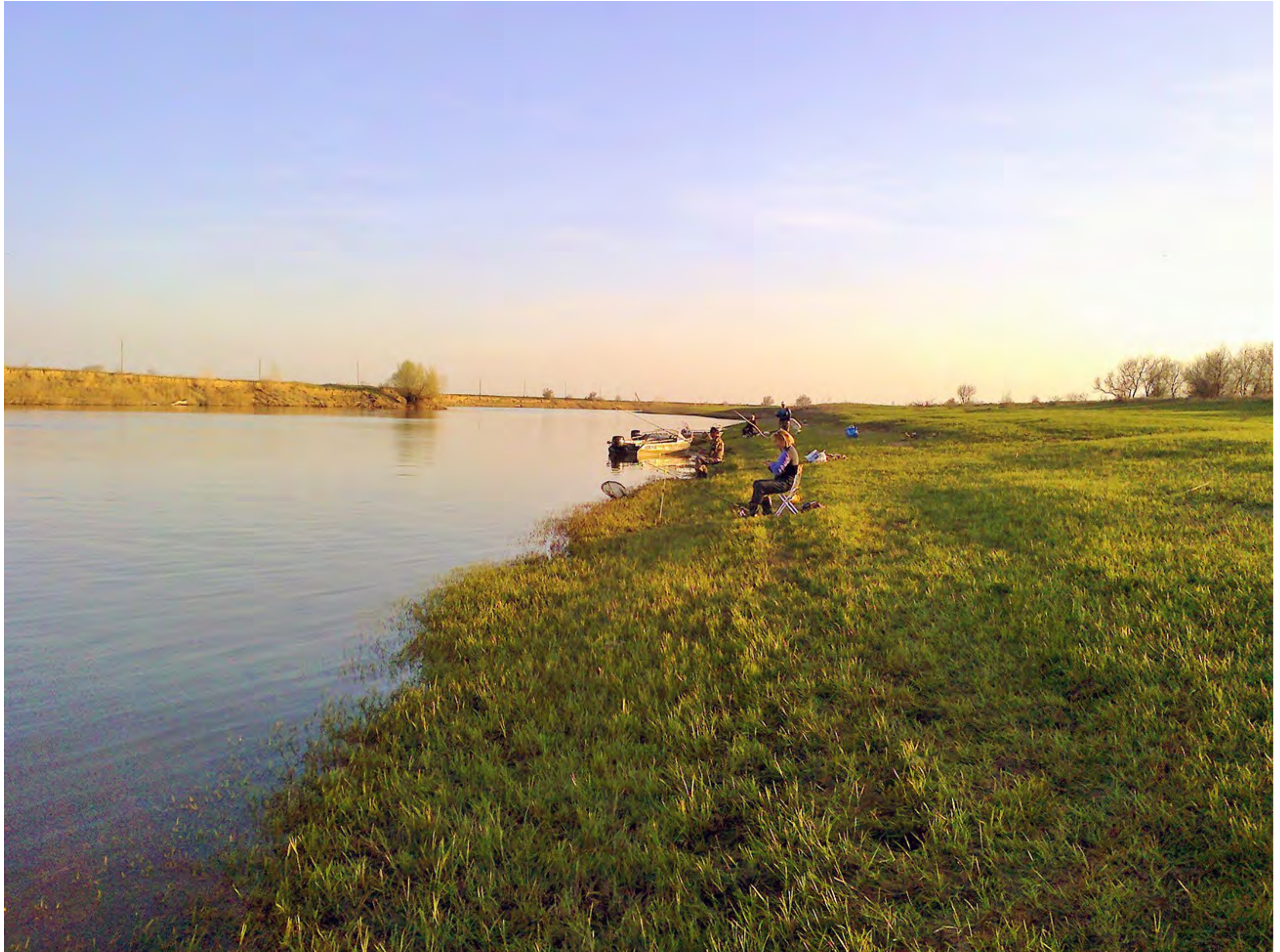
К "нашему" месту подтянулись коллеги (на заднем плане)