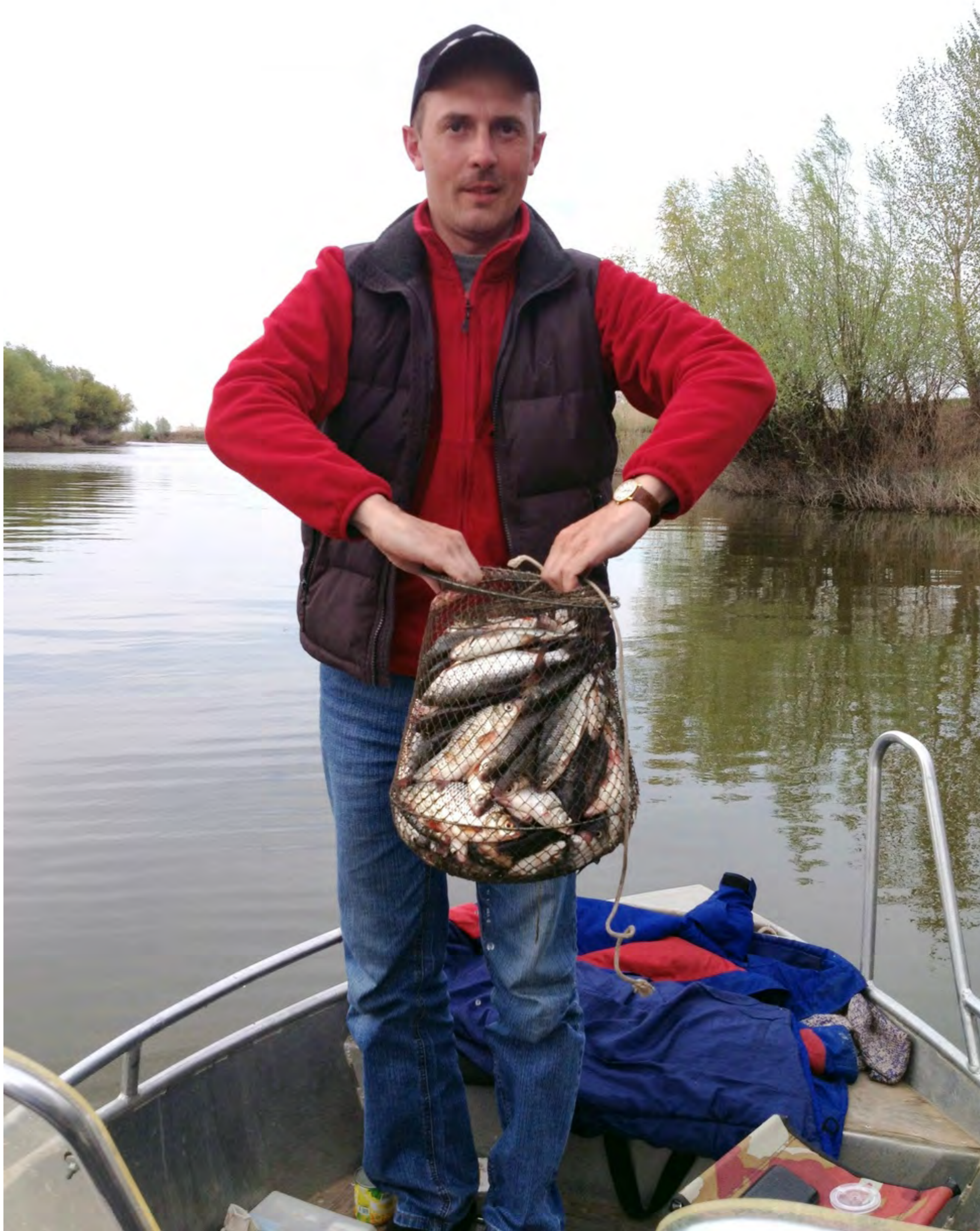
Вот что мы сегодня наловили!