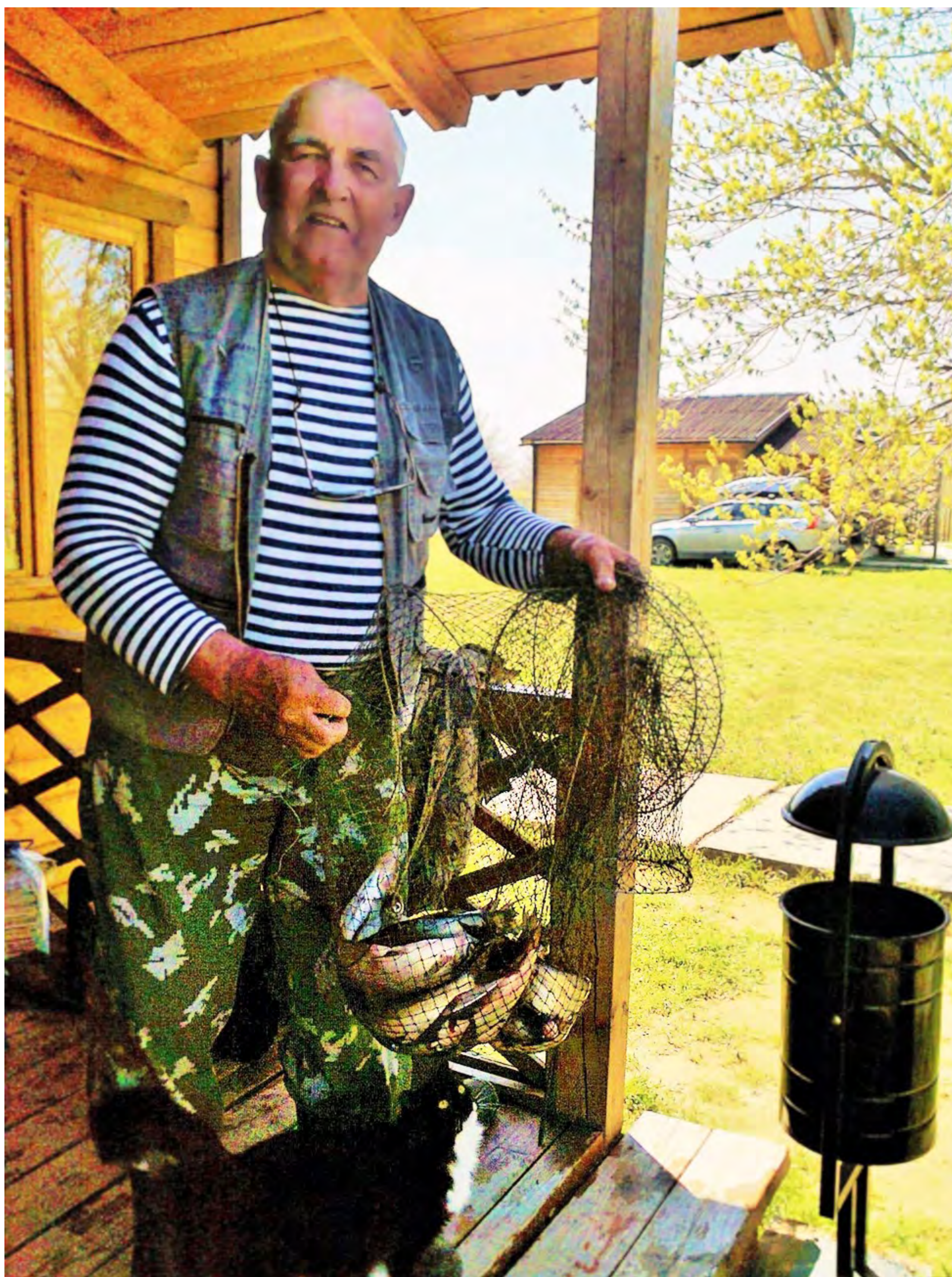
Кое-что набралось с утра