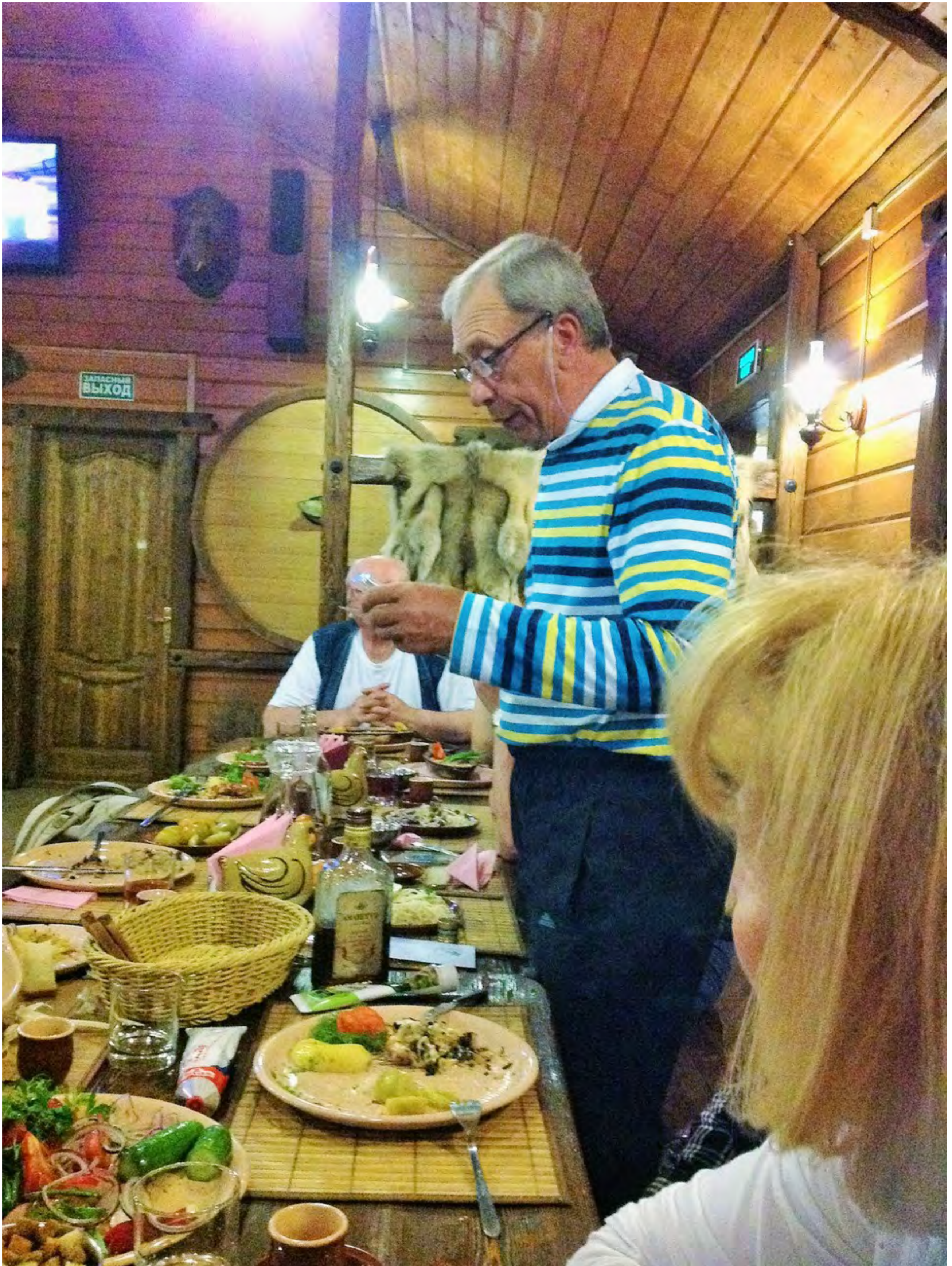
Командир объявляет победителей соревнований