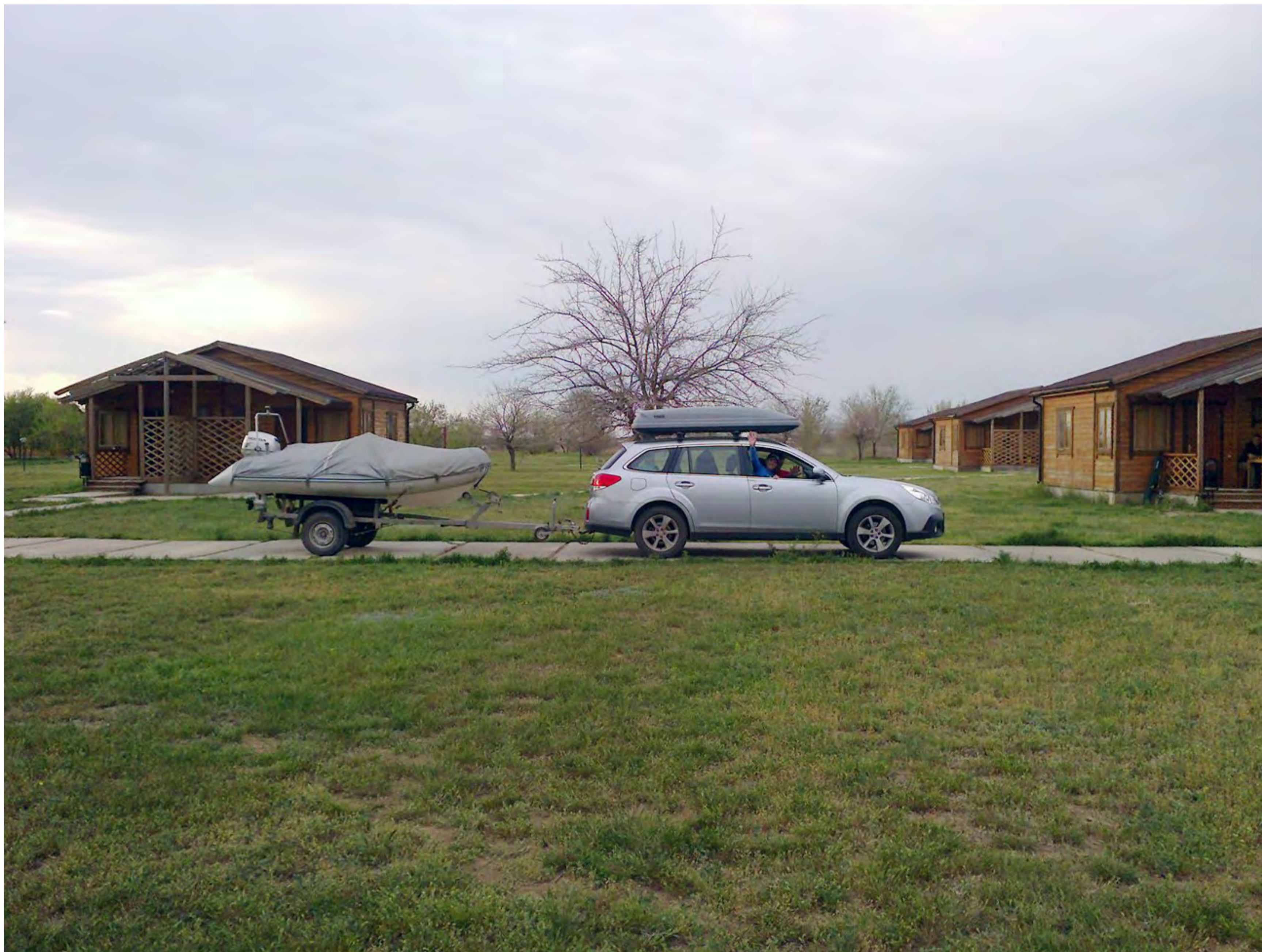
Первыми с базы выезжают Максим с Аленой