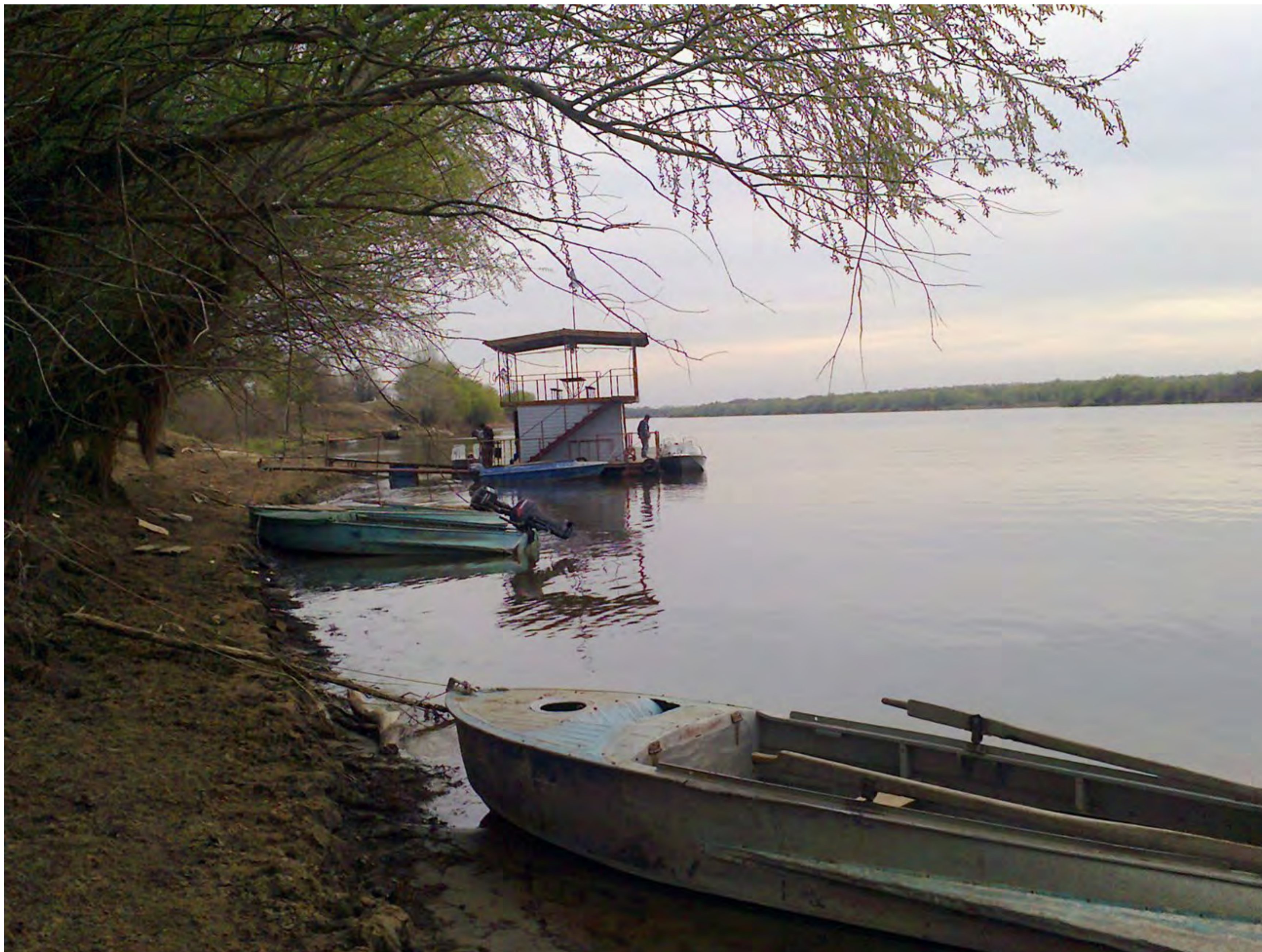
Причал закрыт - все ушли на фронт!