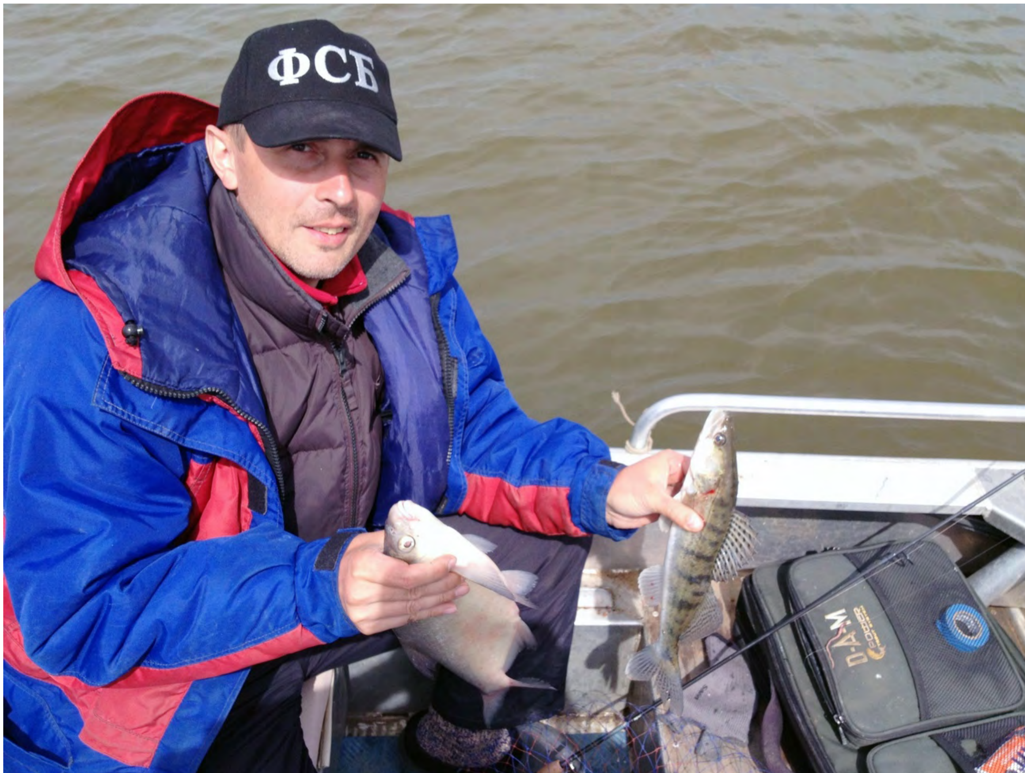
Конечно, имея такую бейсболку, без рыбы не останешься