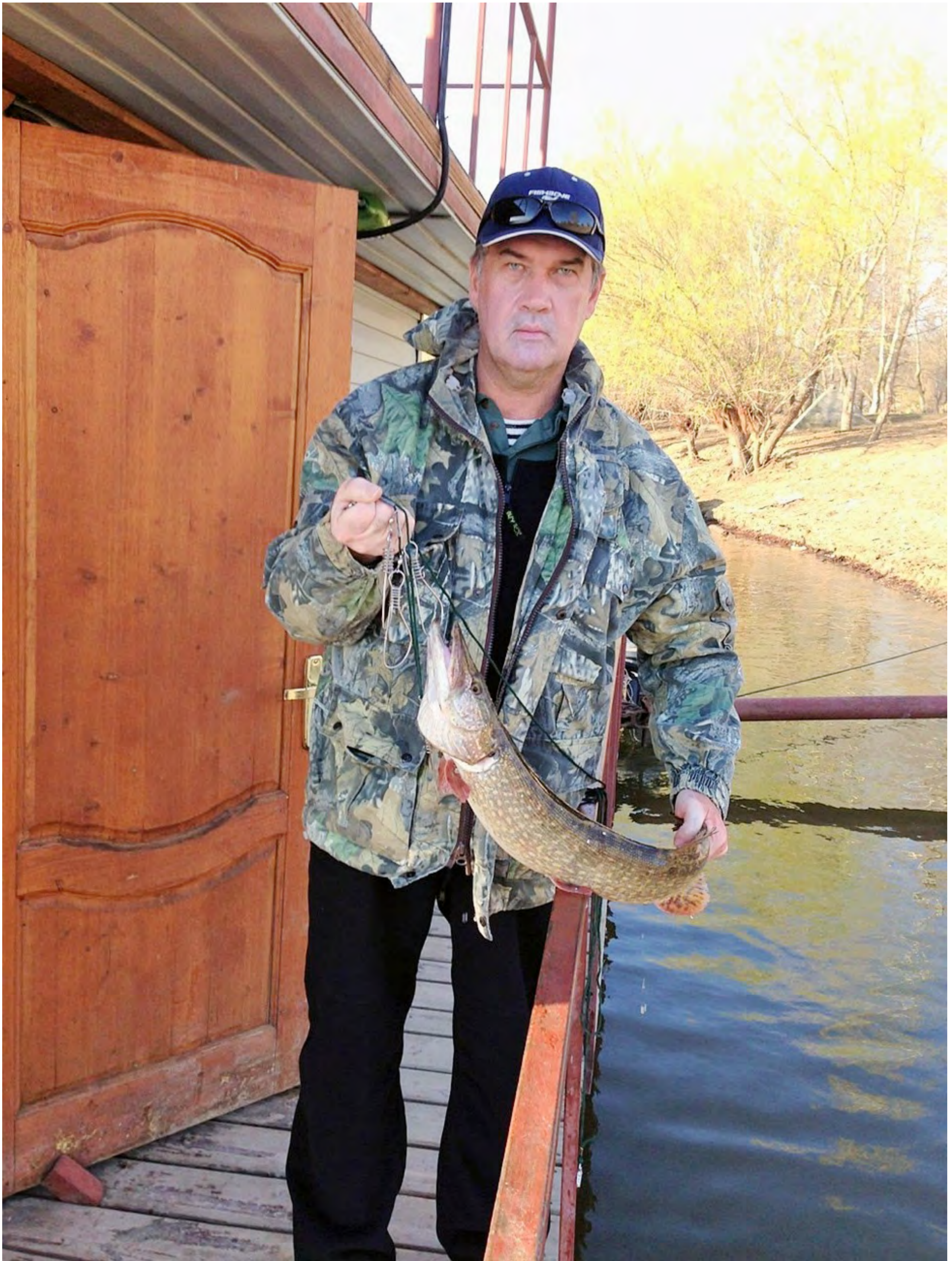
Володя "затролил"-таки свою щуку