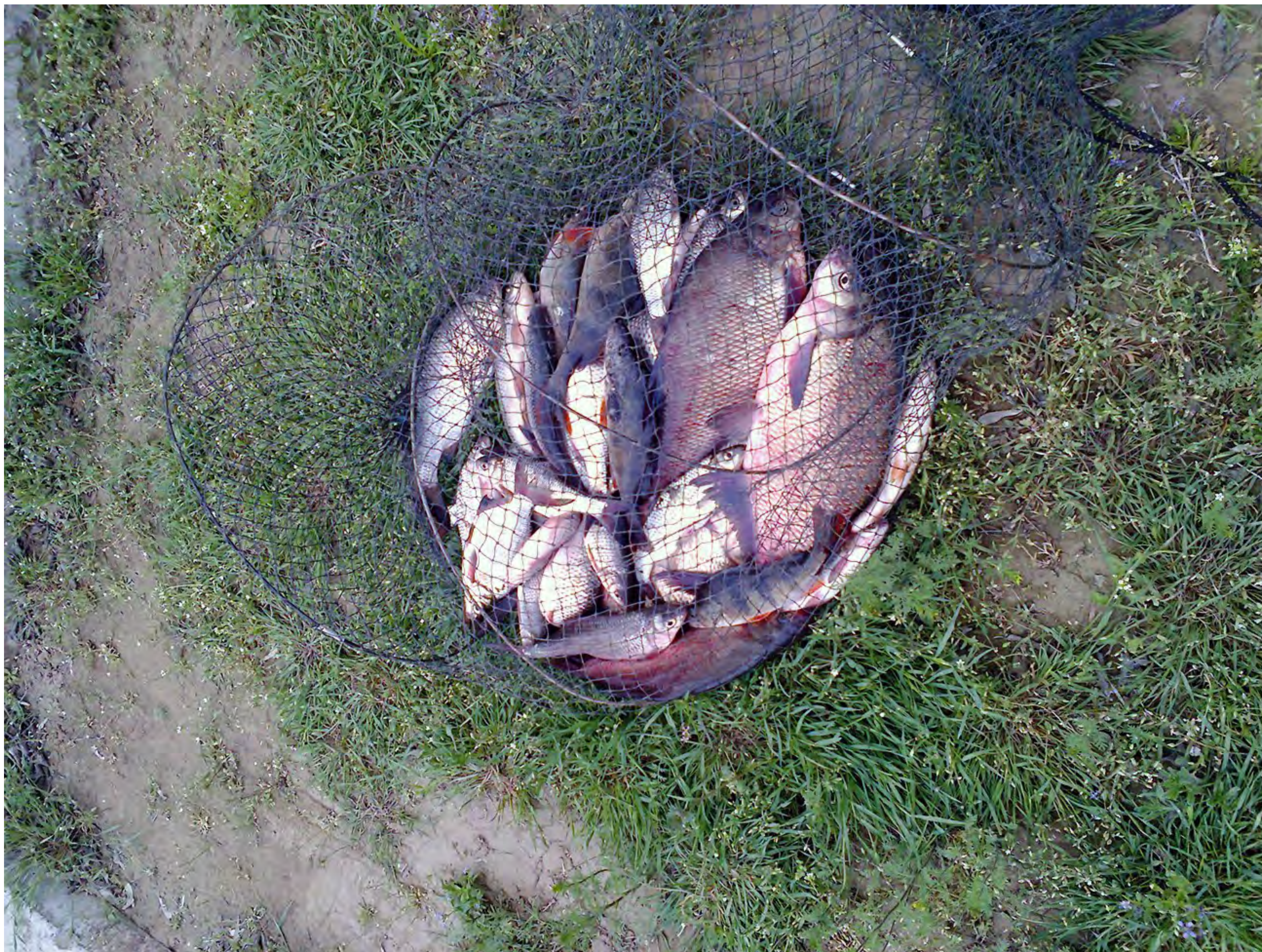
Скромный улов Михалыча