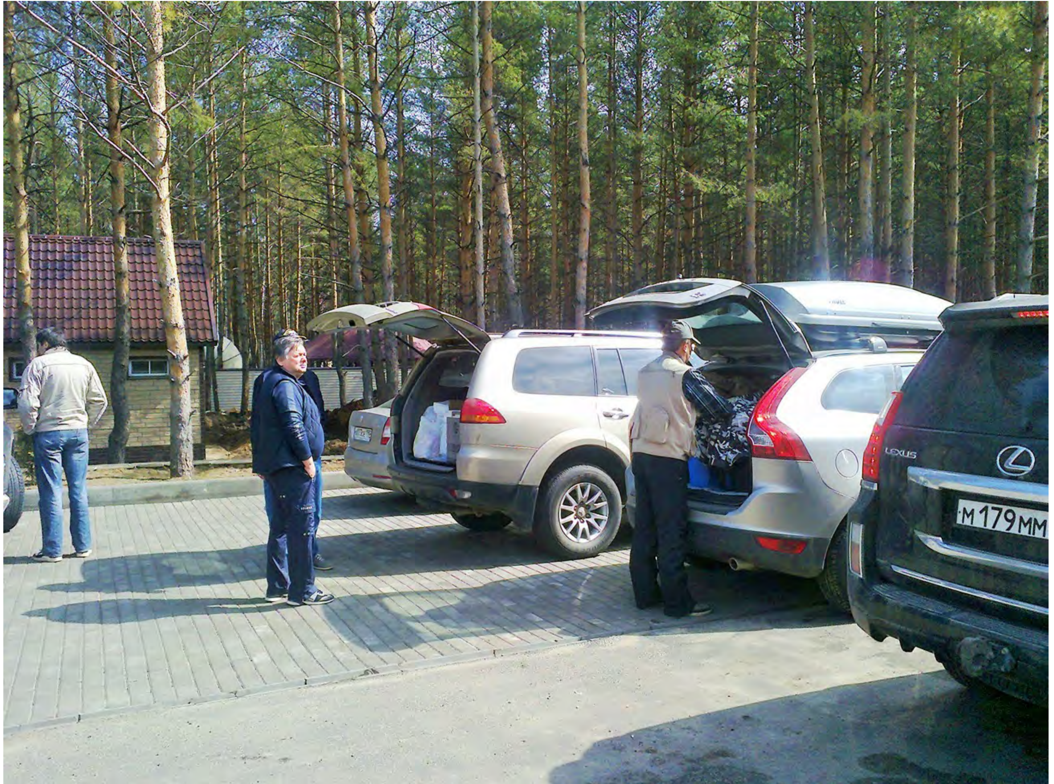
Первая остановка за Тамбовом для короткого отдыха