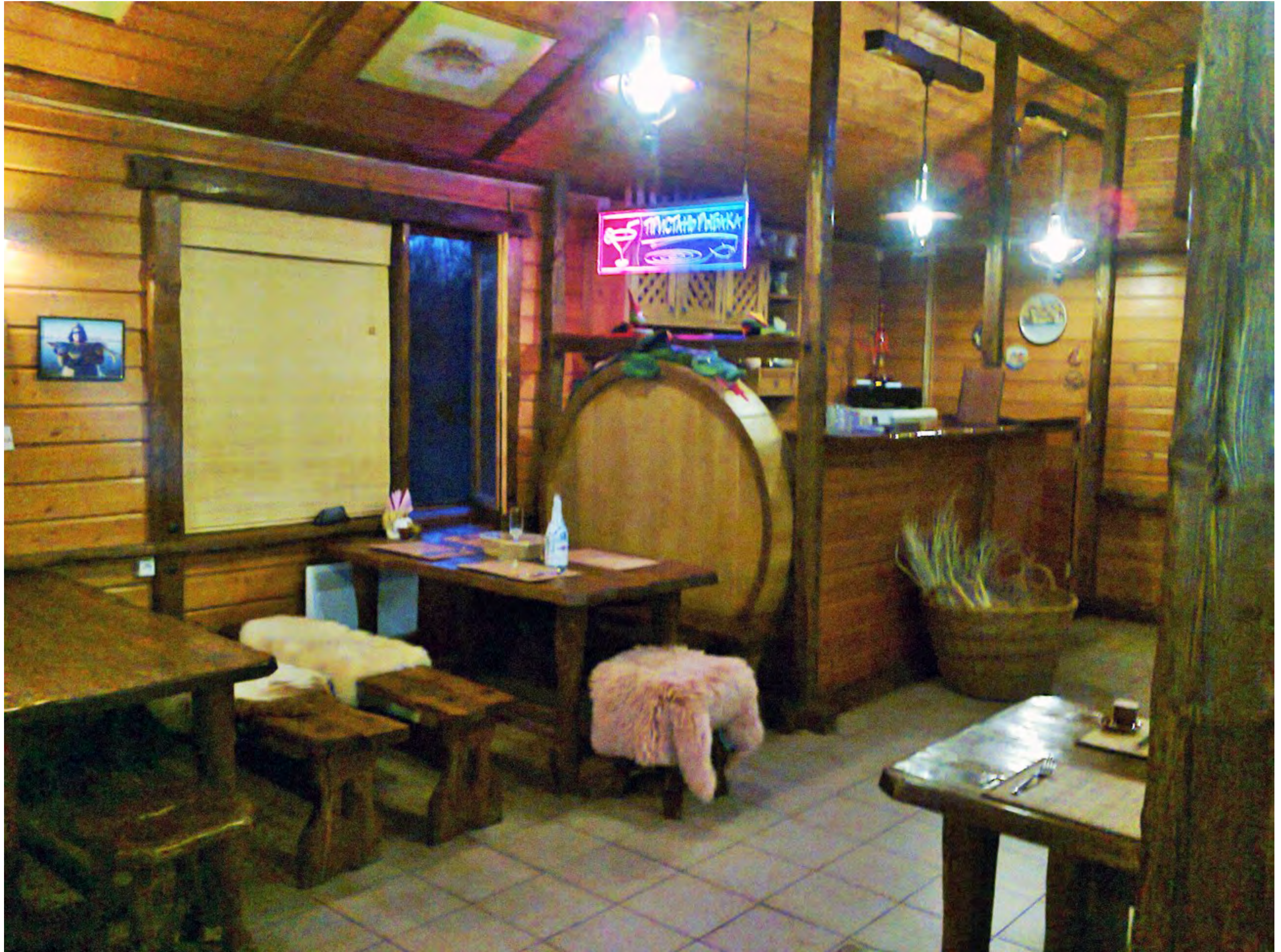
Уютный уголок кафе