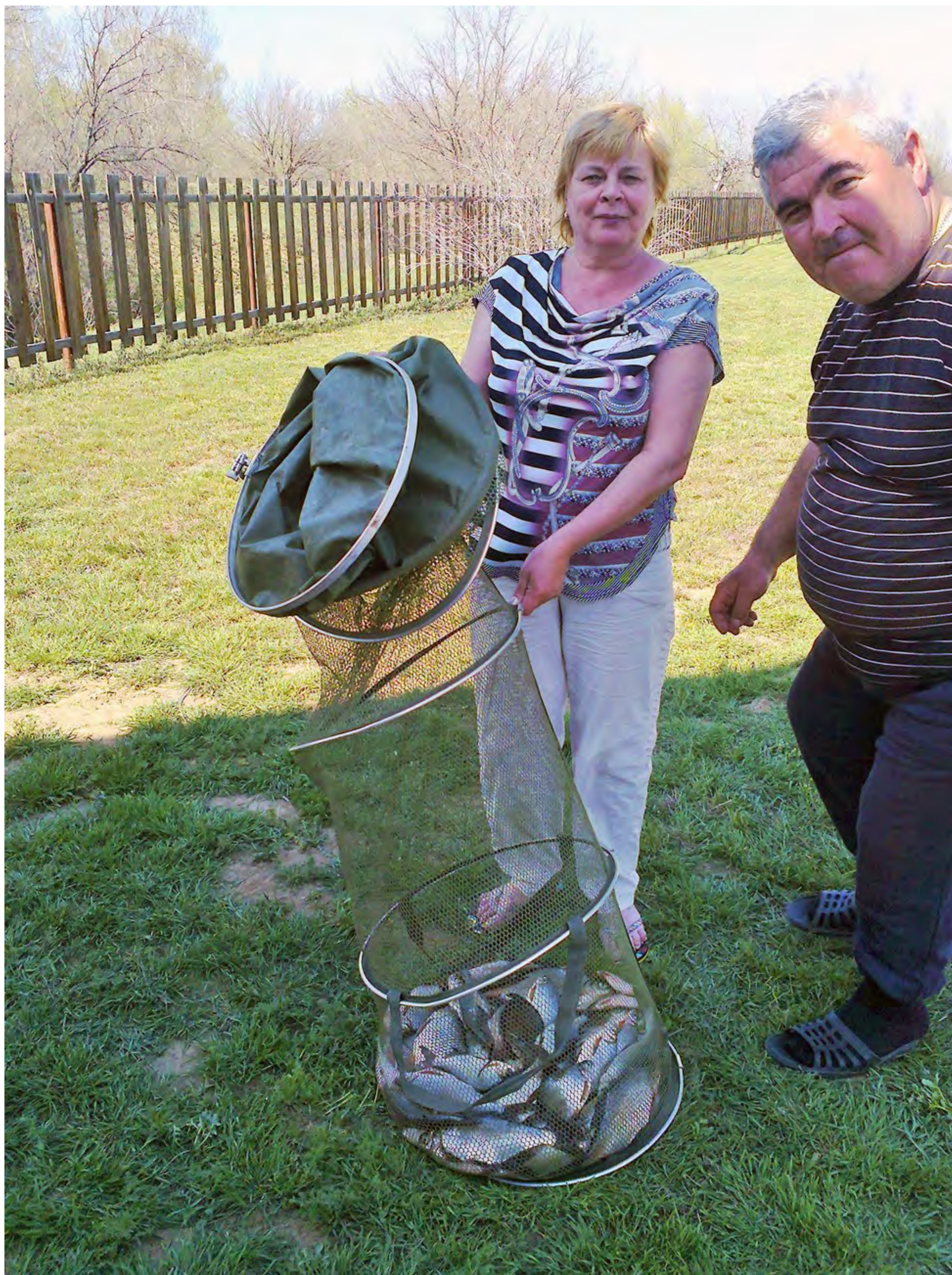
Семейным уловом можно гордиться