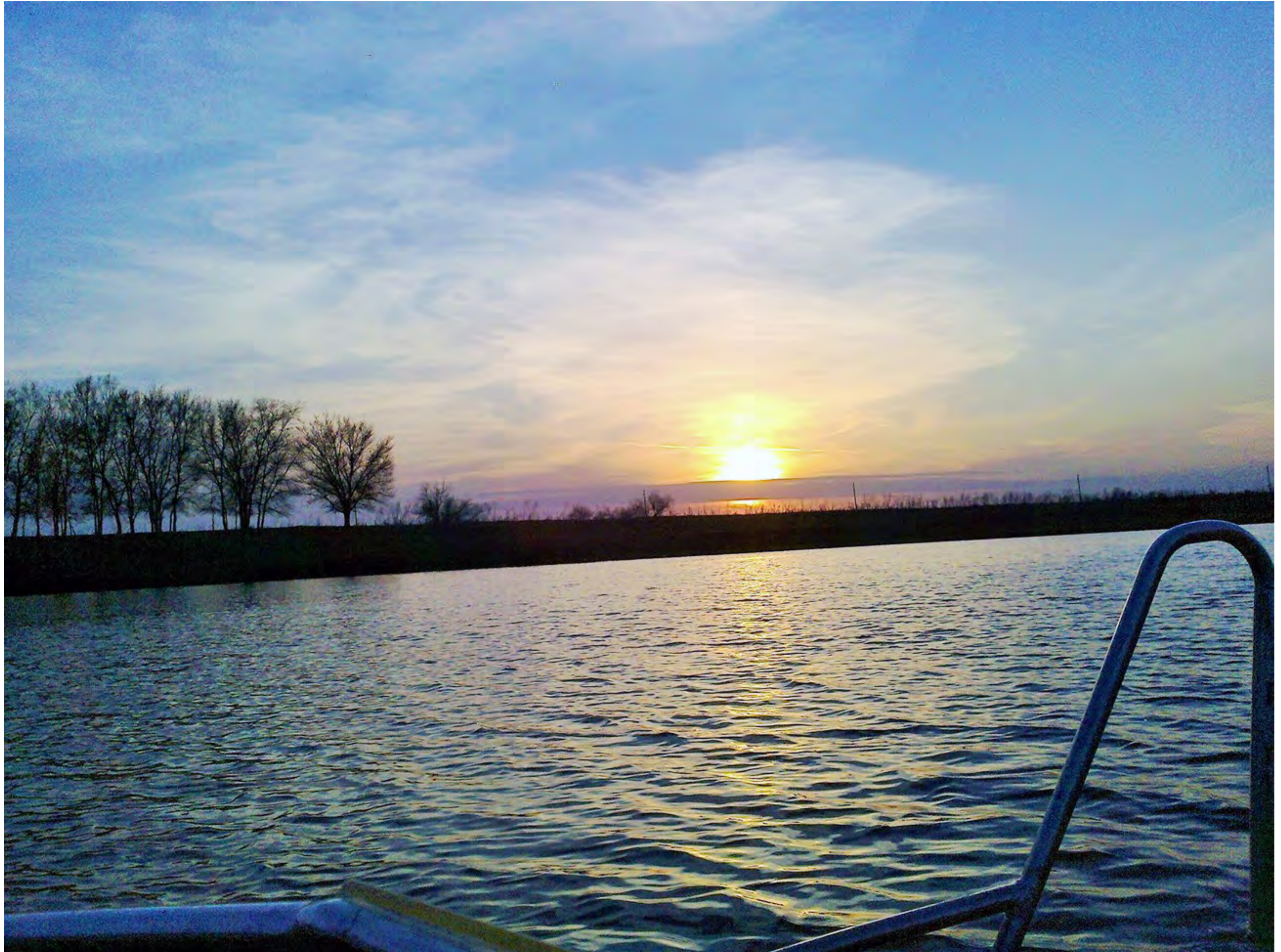
Закат над ериком "Казачий"