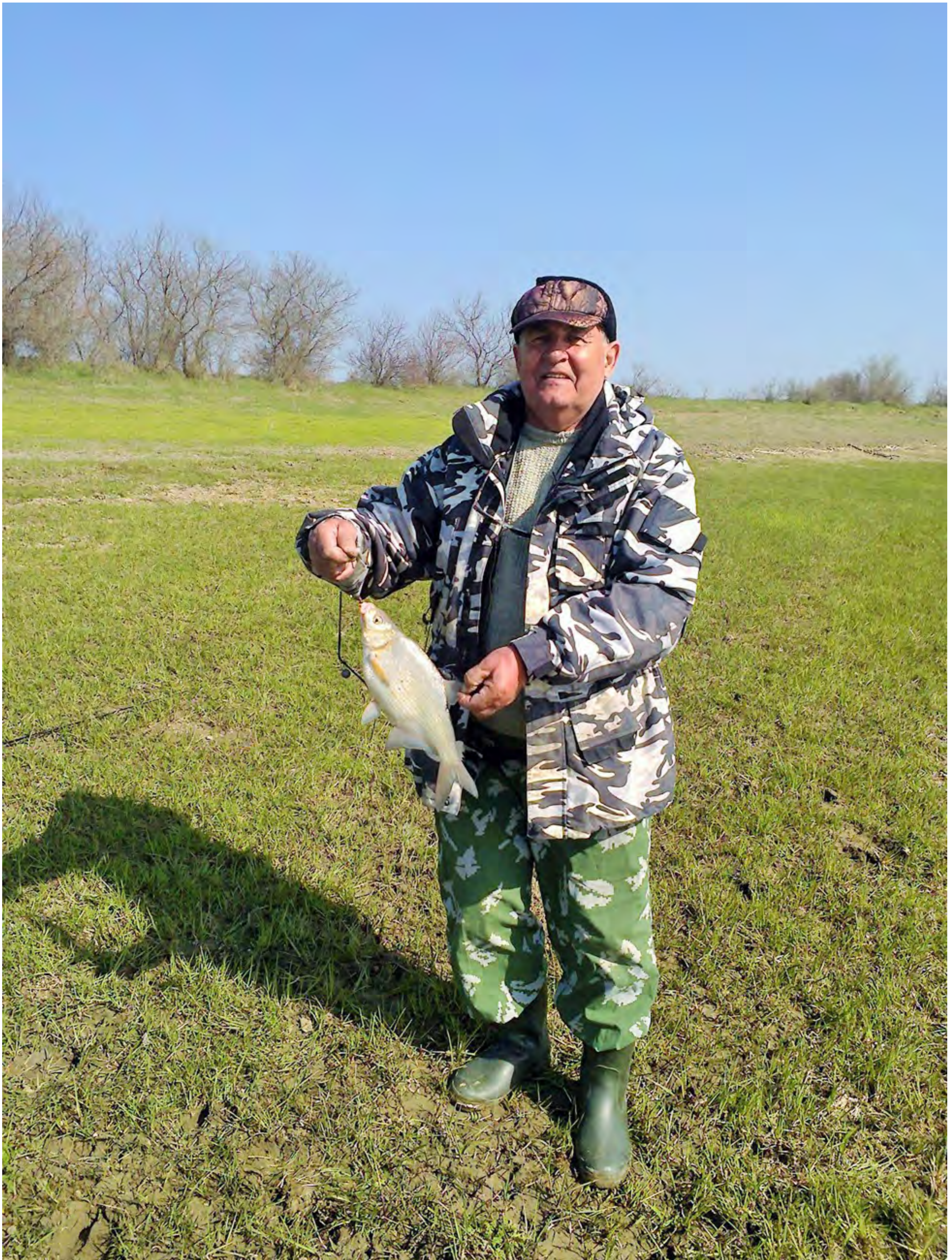
Михалыч тоже не отстает, но слегка уступает в весовом формате