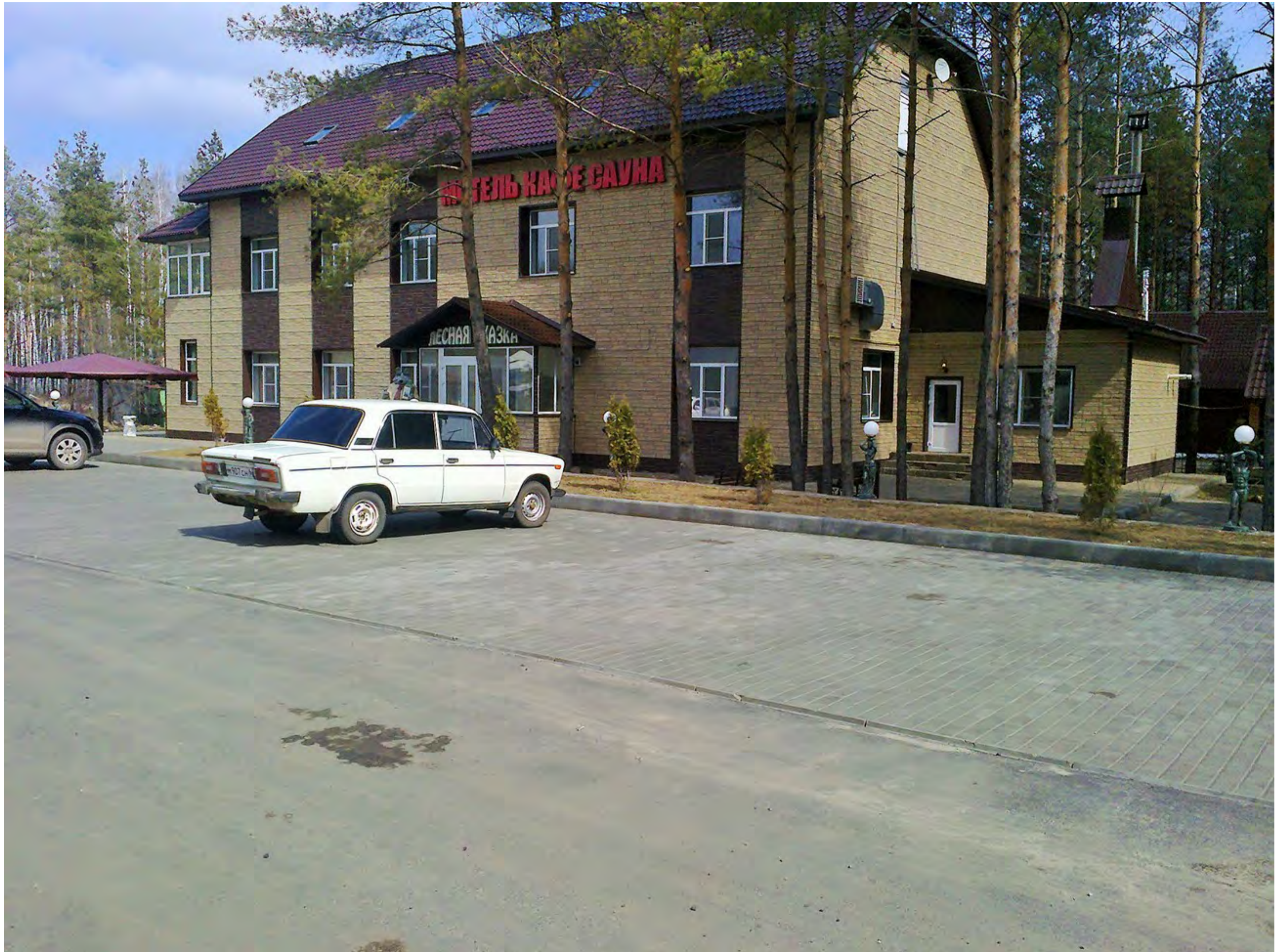
Мотель "Лесная сказка", где мы иногда останавливаемся на ночлег по пути домой