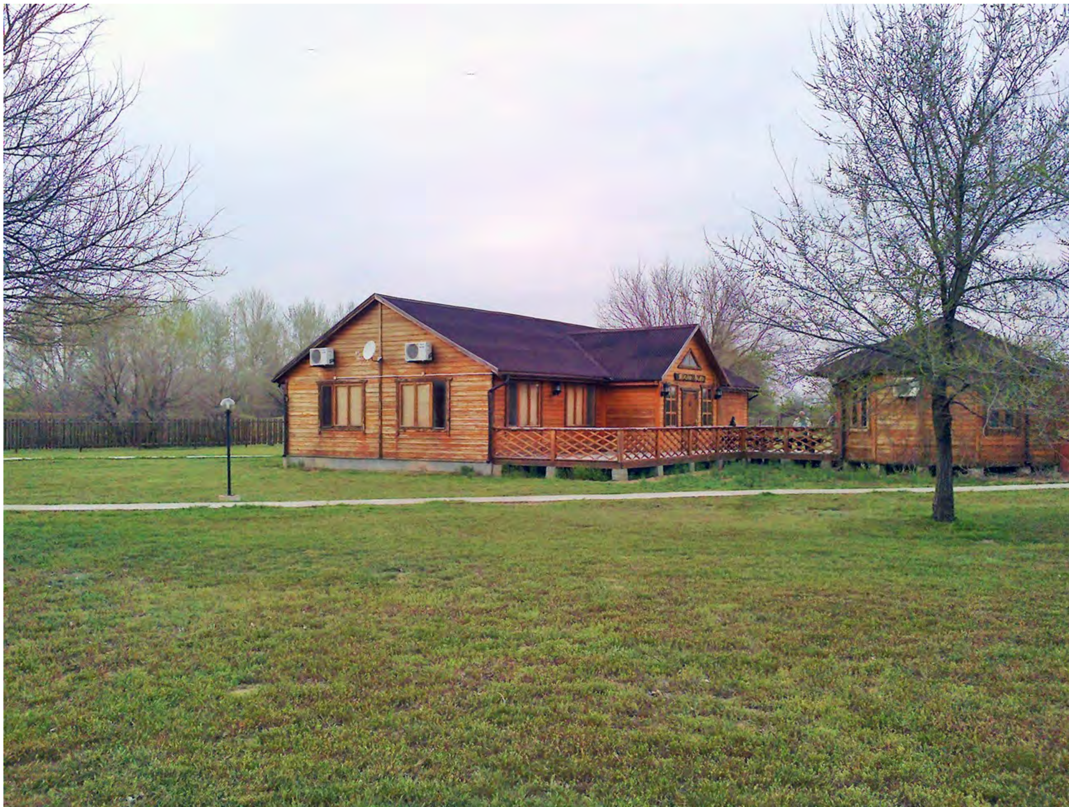
Кафе на базе "Пристань рыбака"