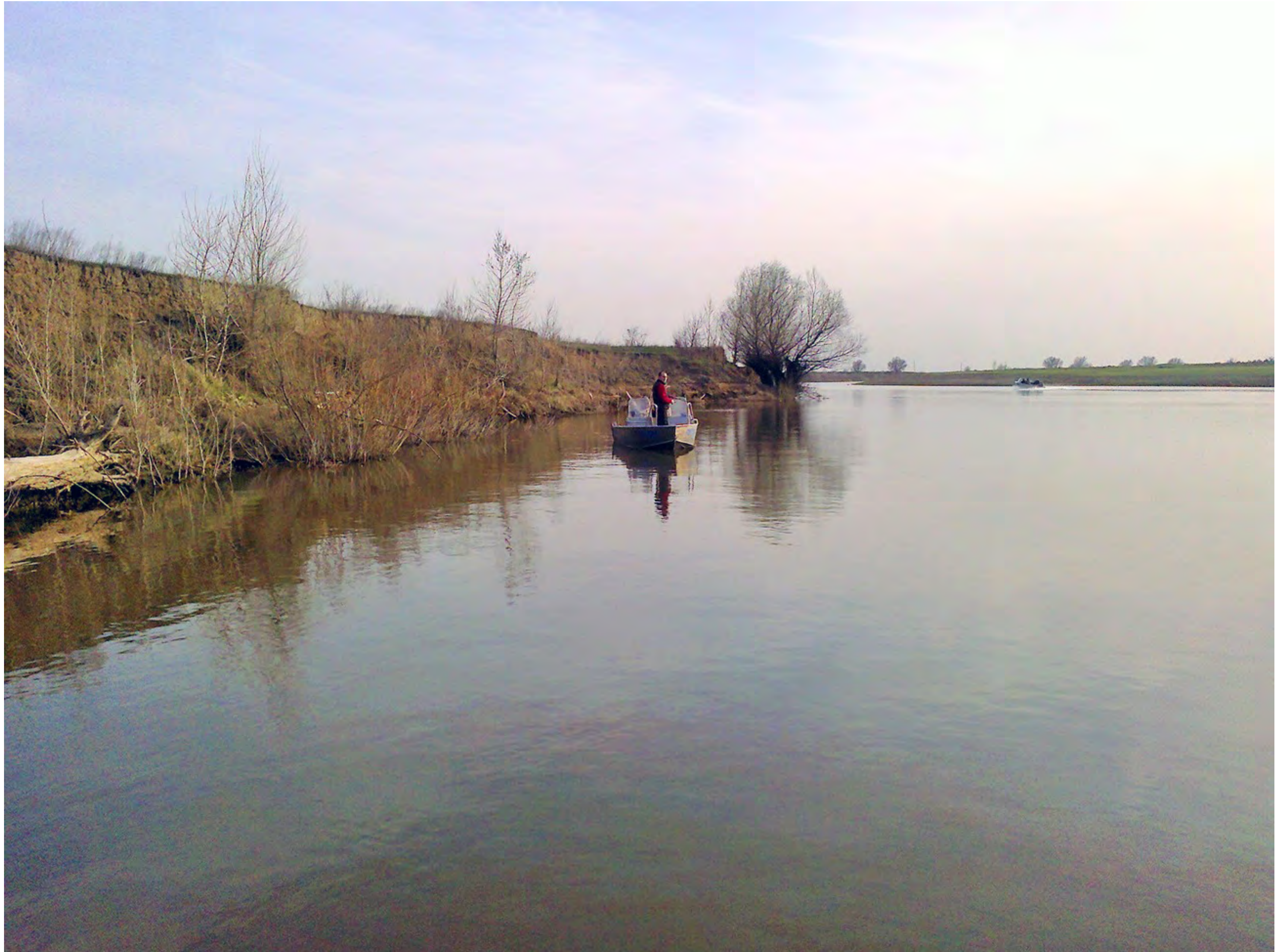
Первая разведка на ерике "Казачий"