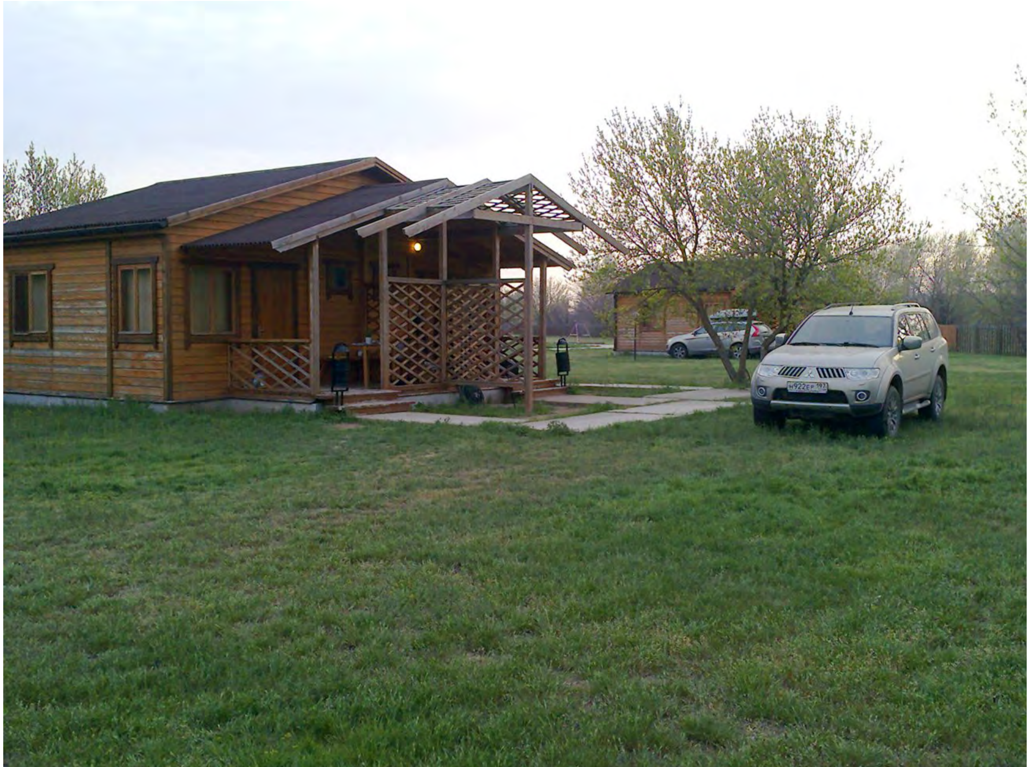
Наш приют на 7 дней