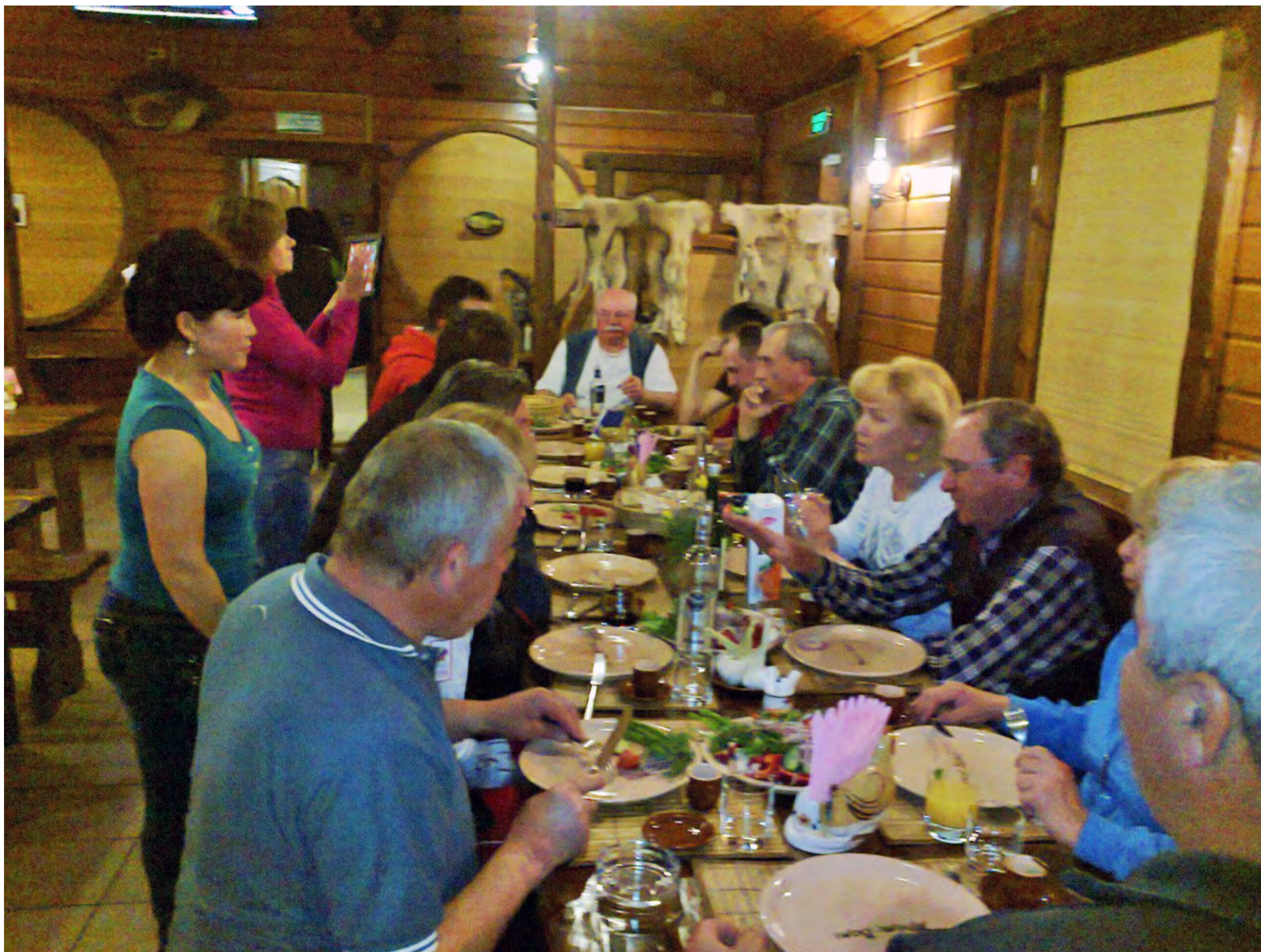
Скромный ужин в кафе