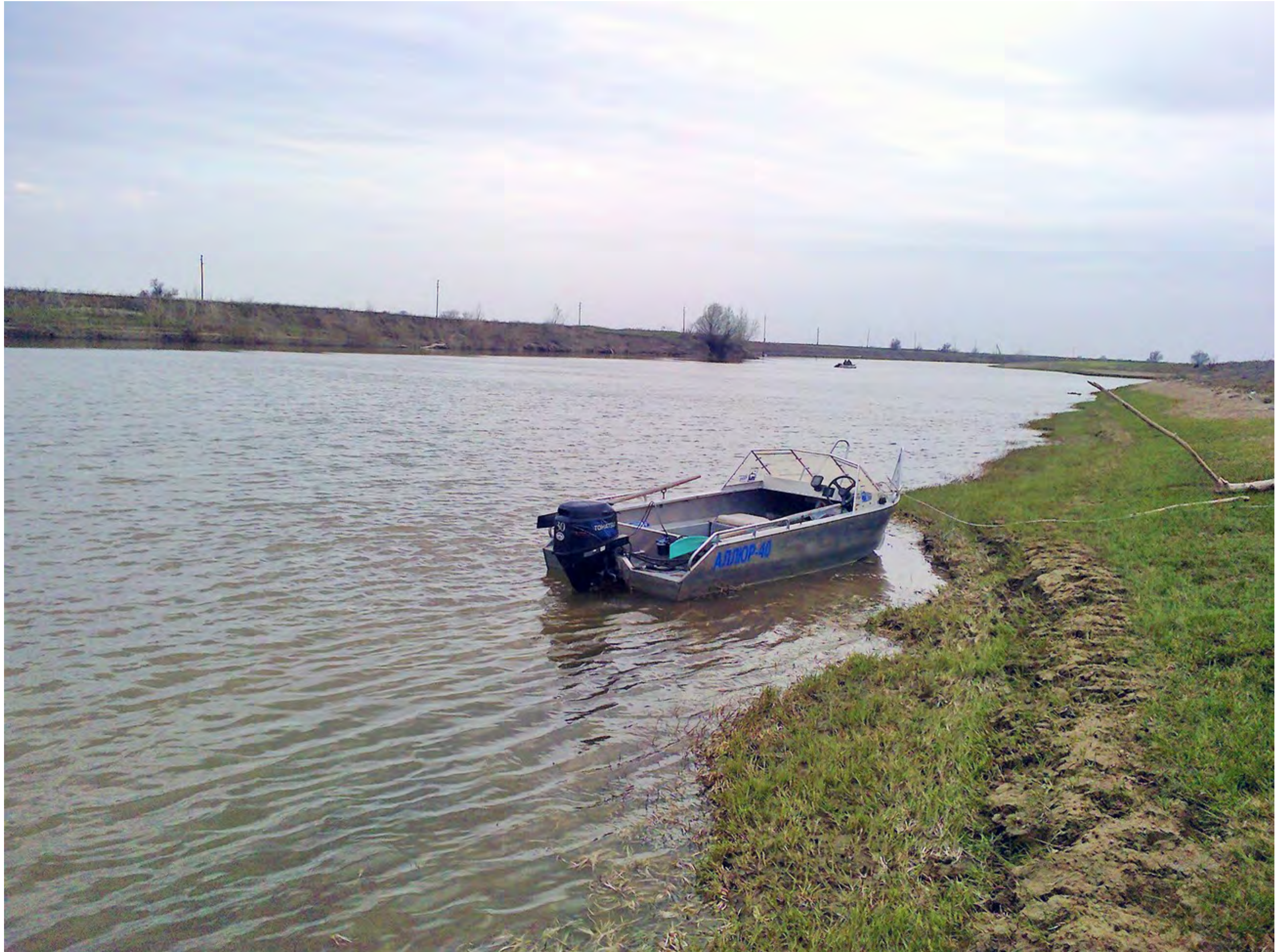
Наш Аллюр-40 отдыхает