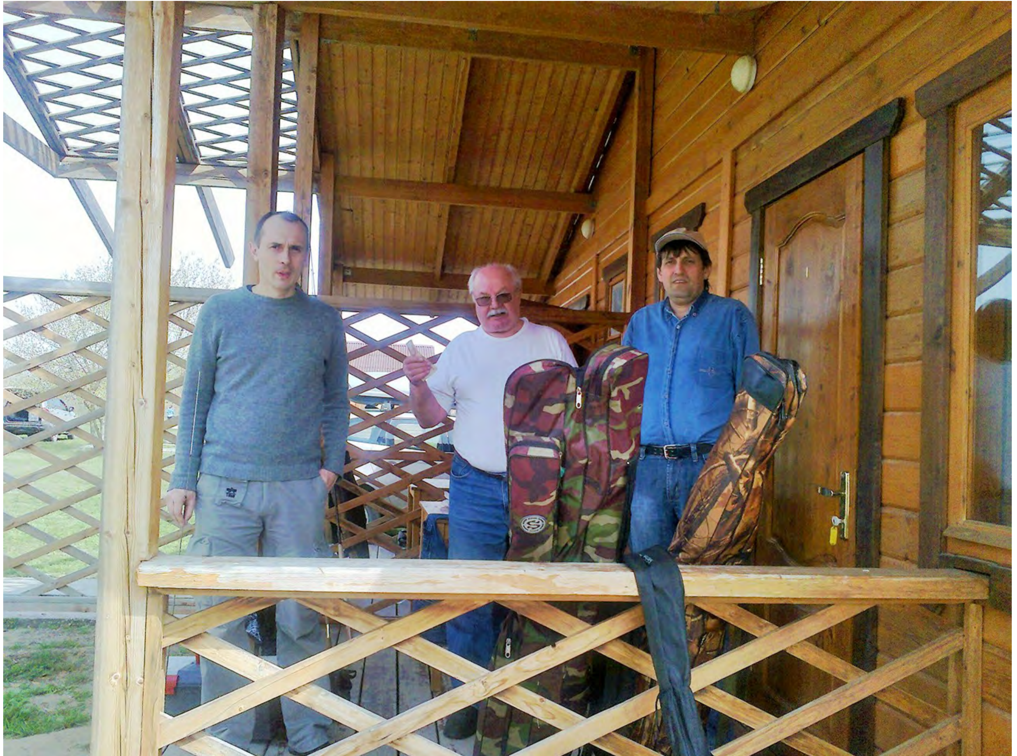
Молодежь рвется в бой впереди ветеранов