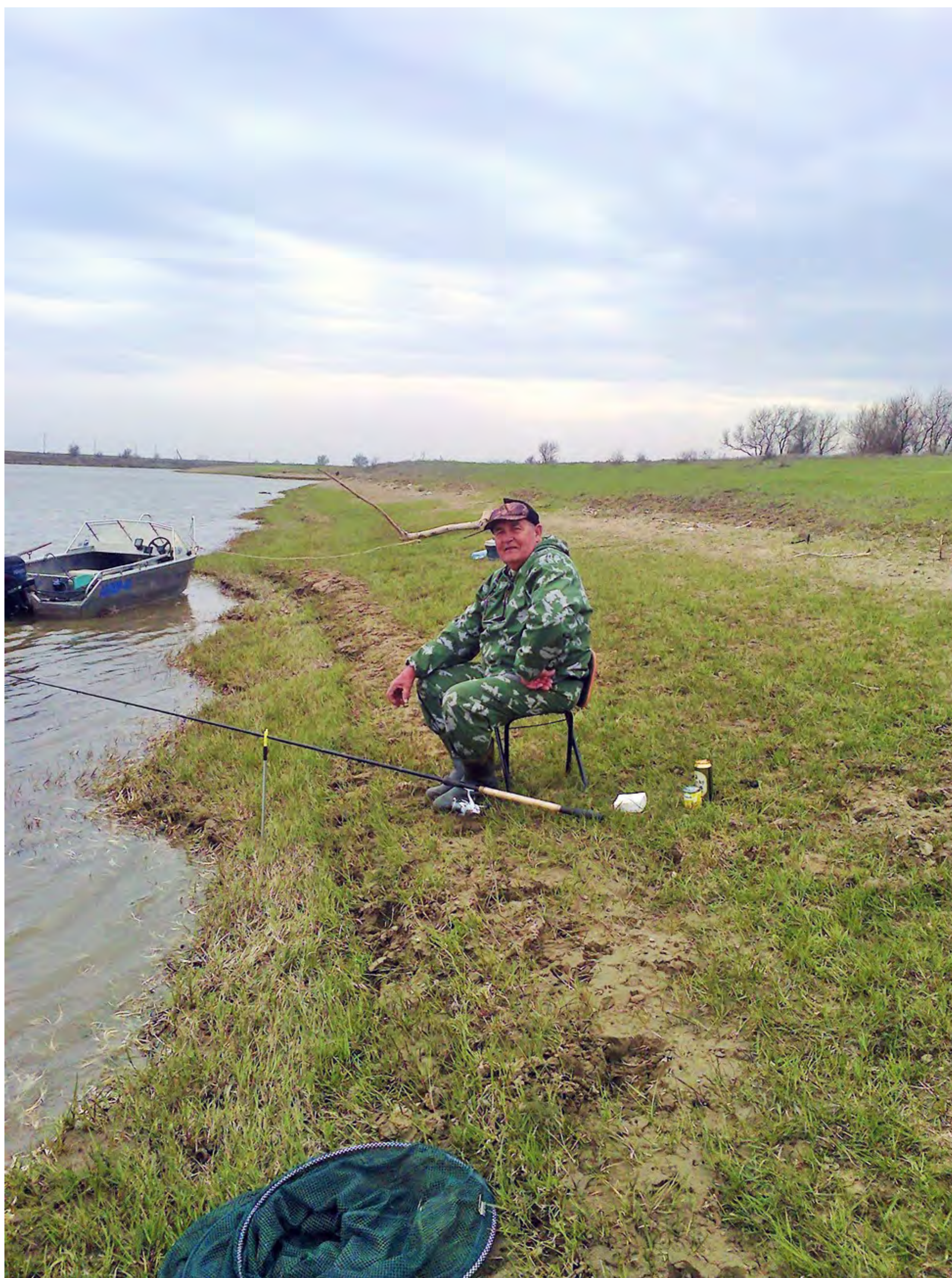
В ожидании первых поклевков