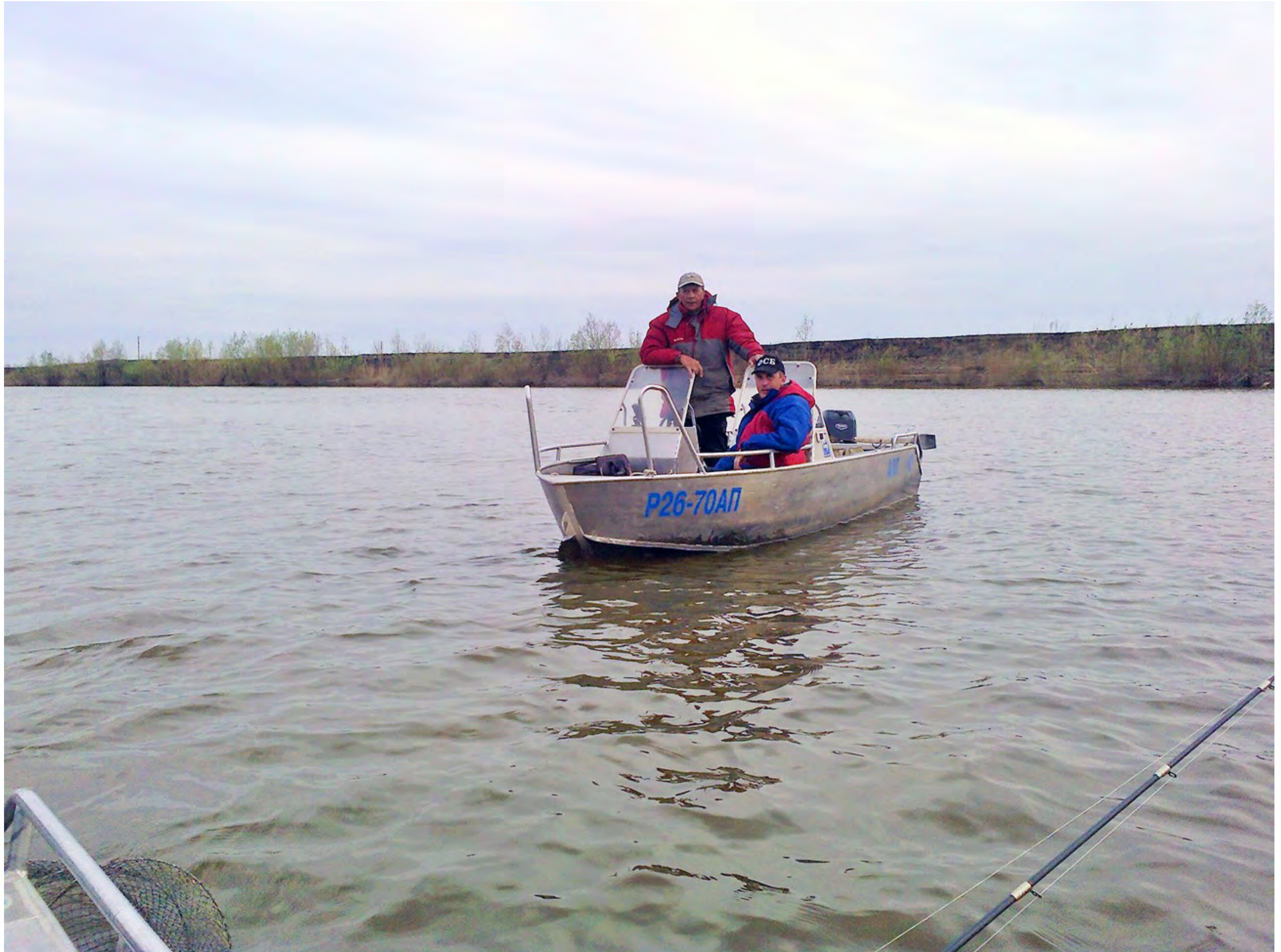
Встреча на рейде с друзьями