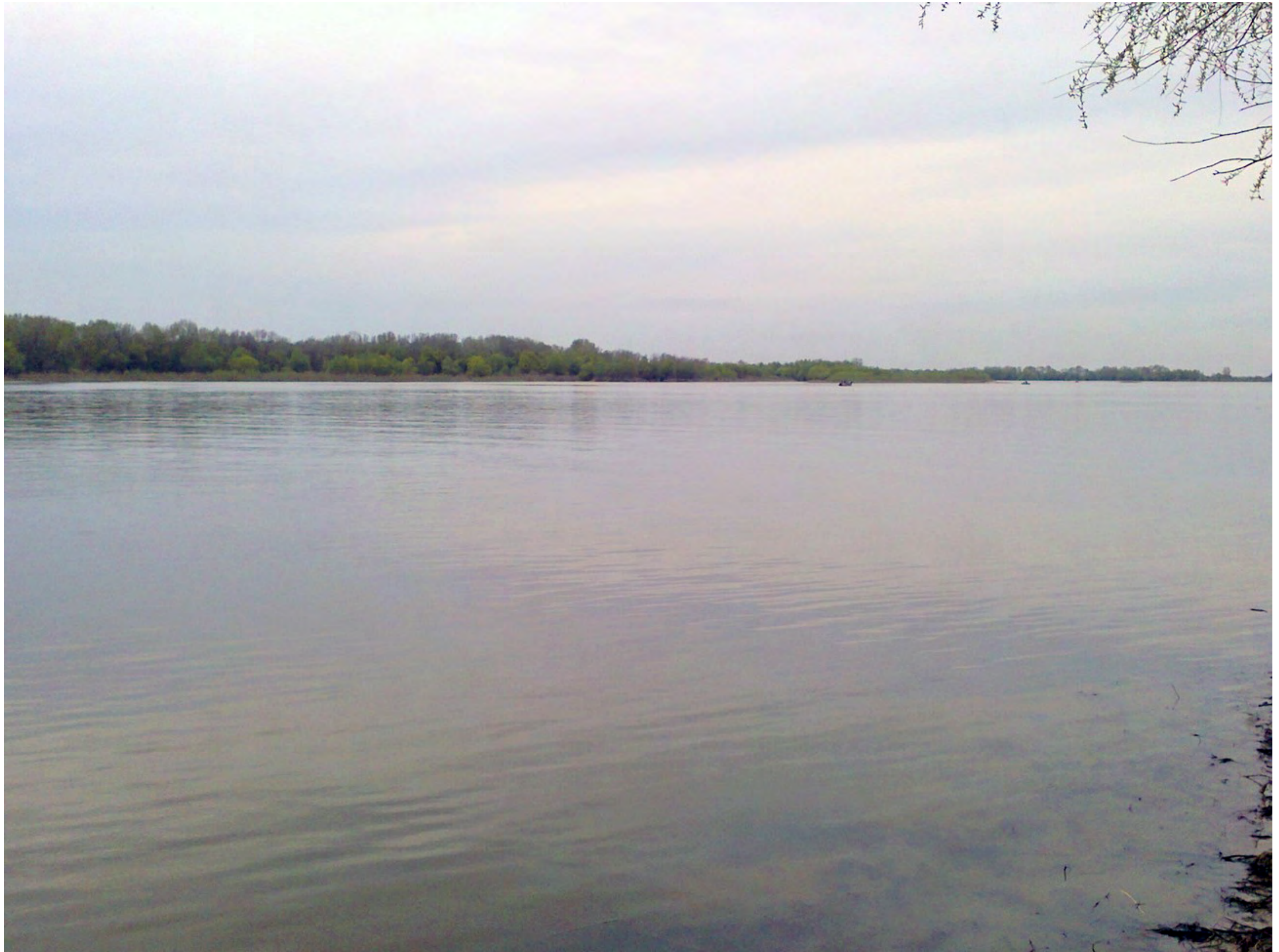
Митинка в своей красе