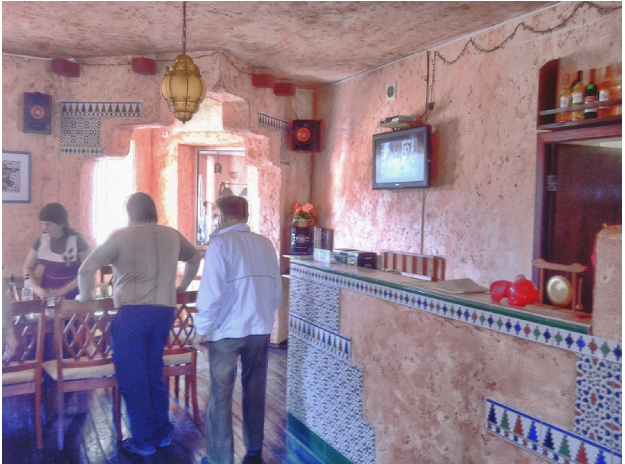
Перед рыбалкой надо пообедать