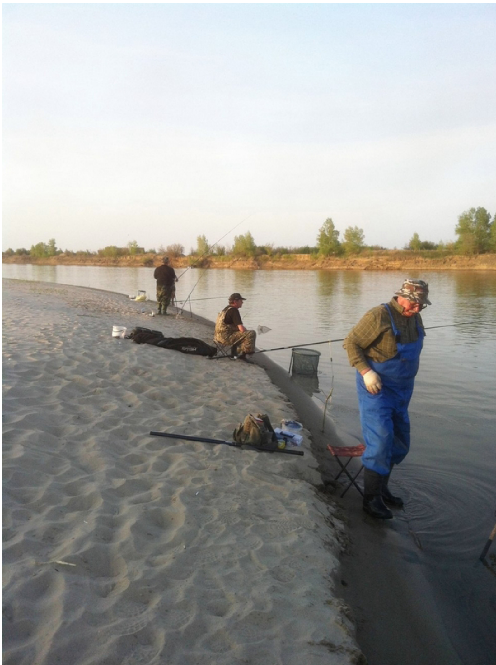
Погода шикарная - клёв отменный