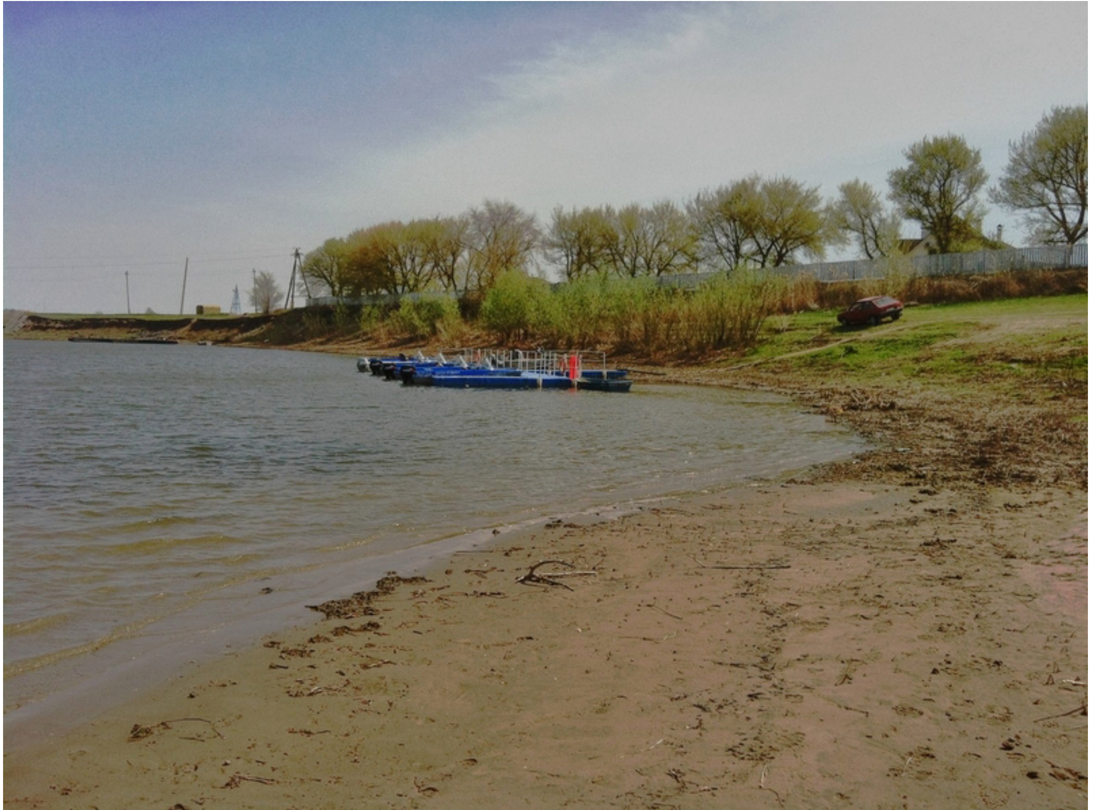
Причал базы "Путина" на ерике "Казачий"