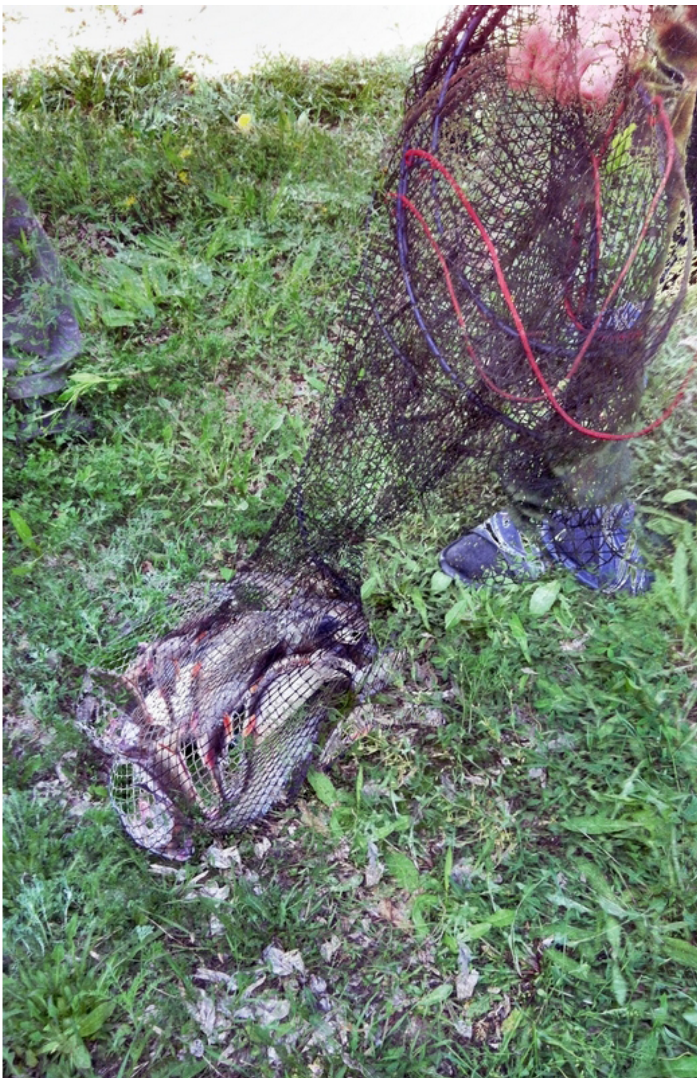
Чего здесь только нет