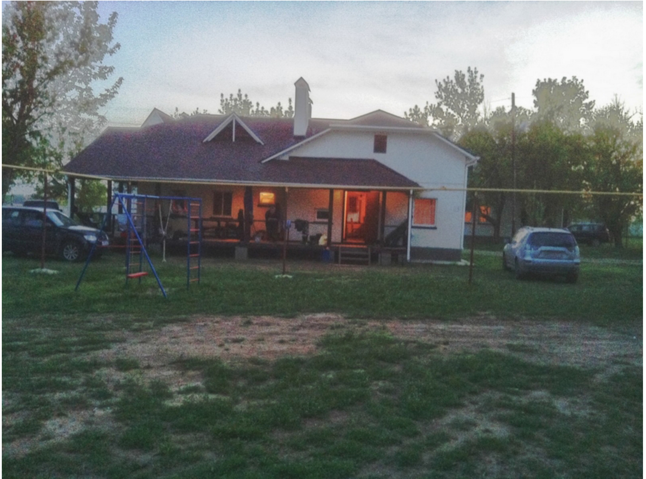
Вечером на базе