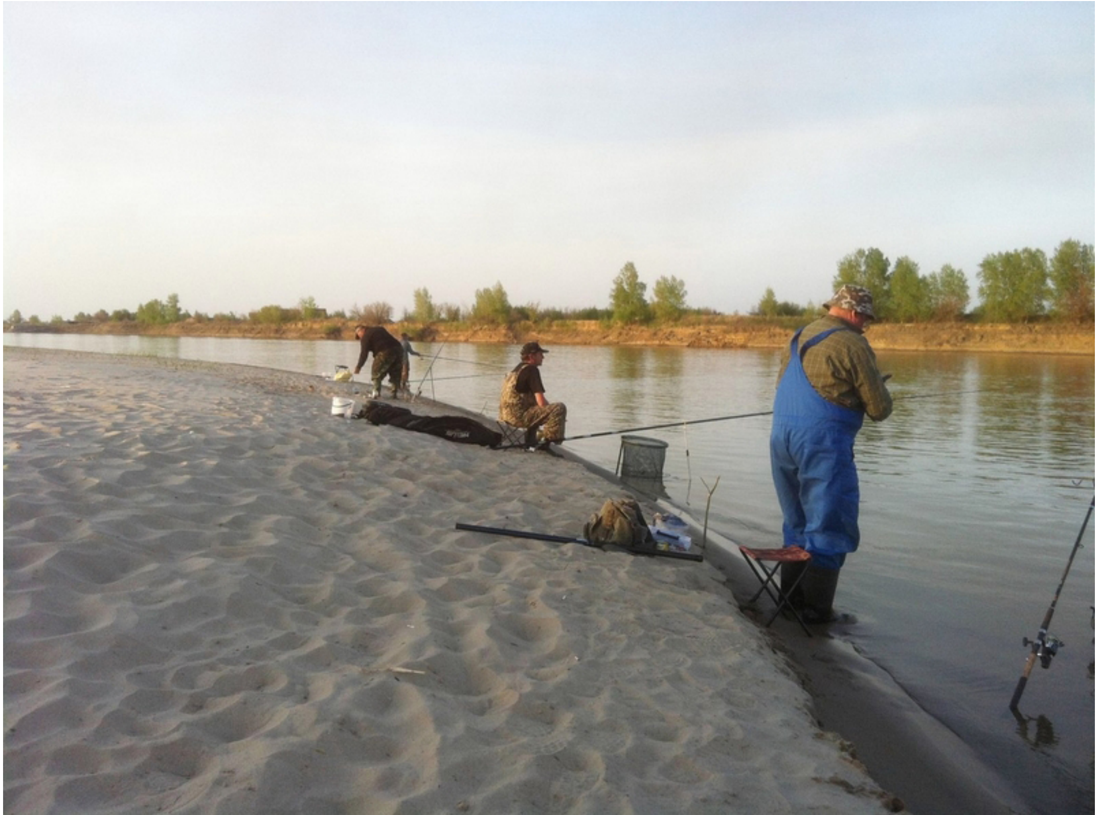
Это ещё одно из наших мест удачной ловли