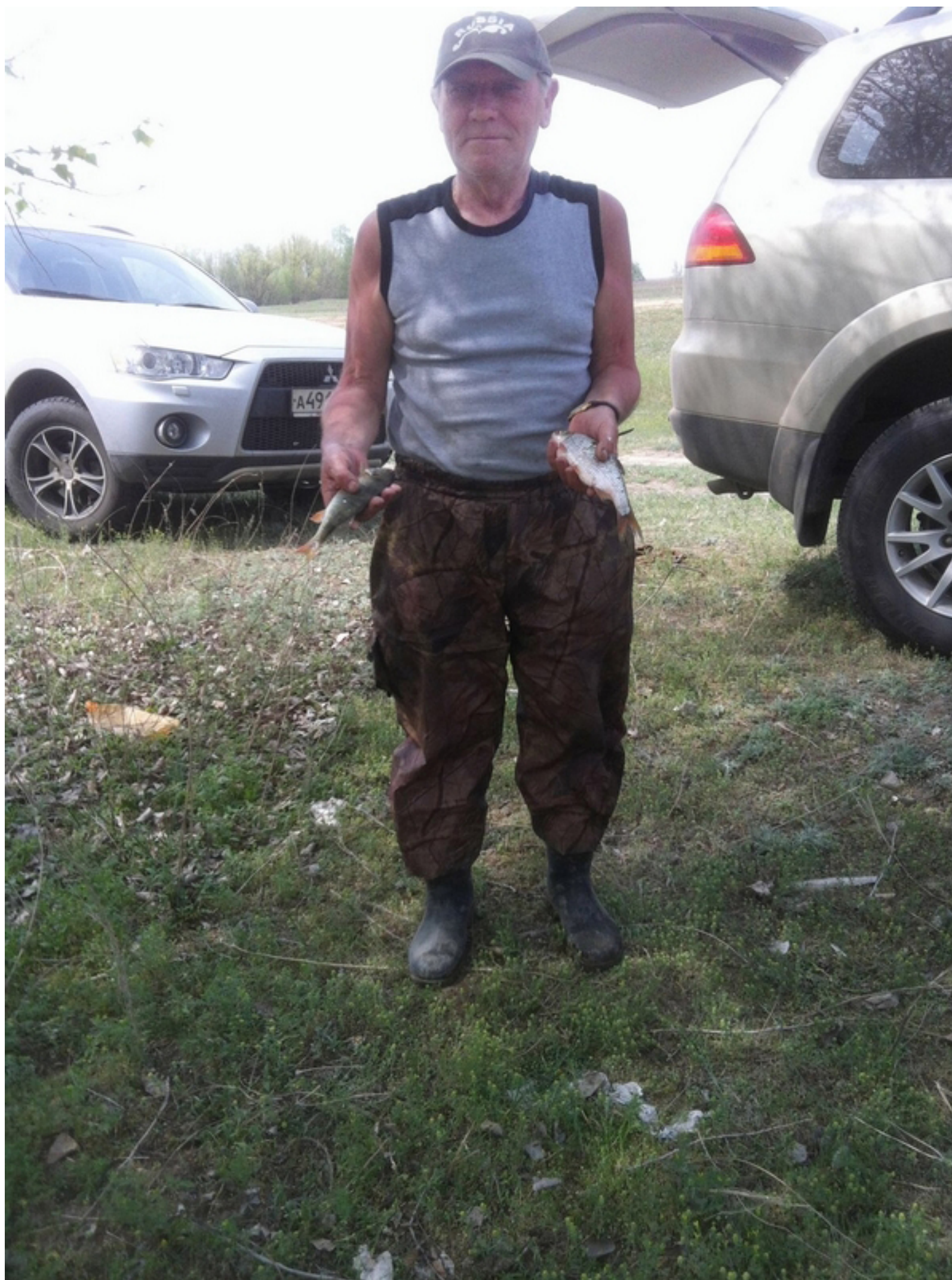
Михаил Васильевич явно скромничает