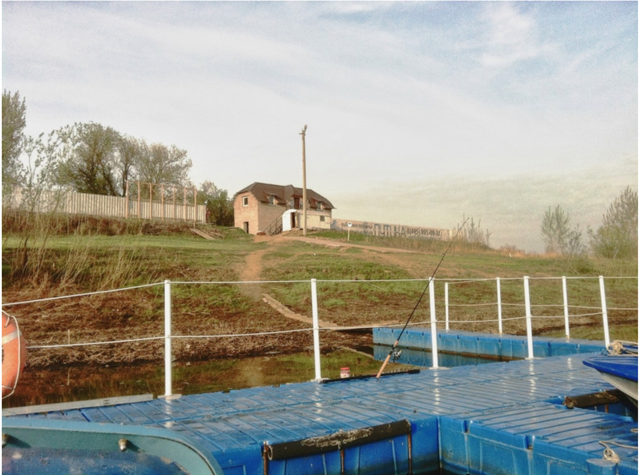
Это наша тропа к причалу