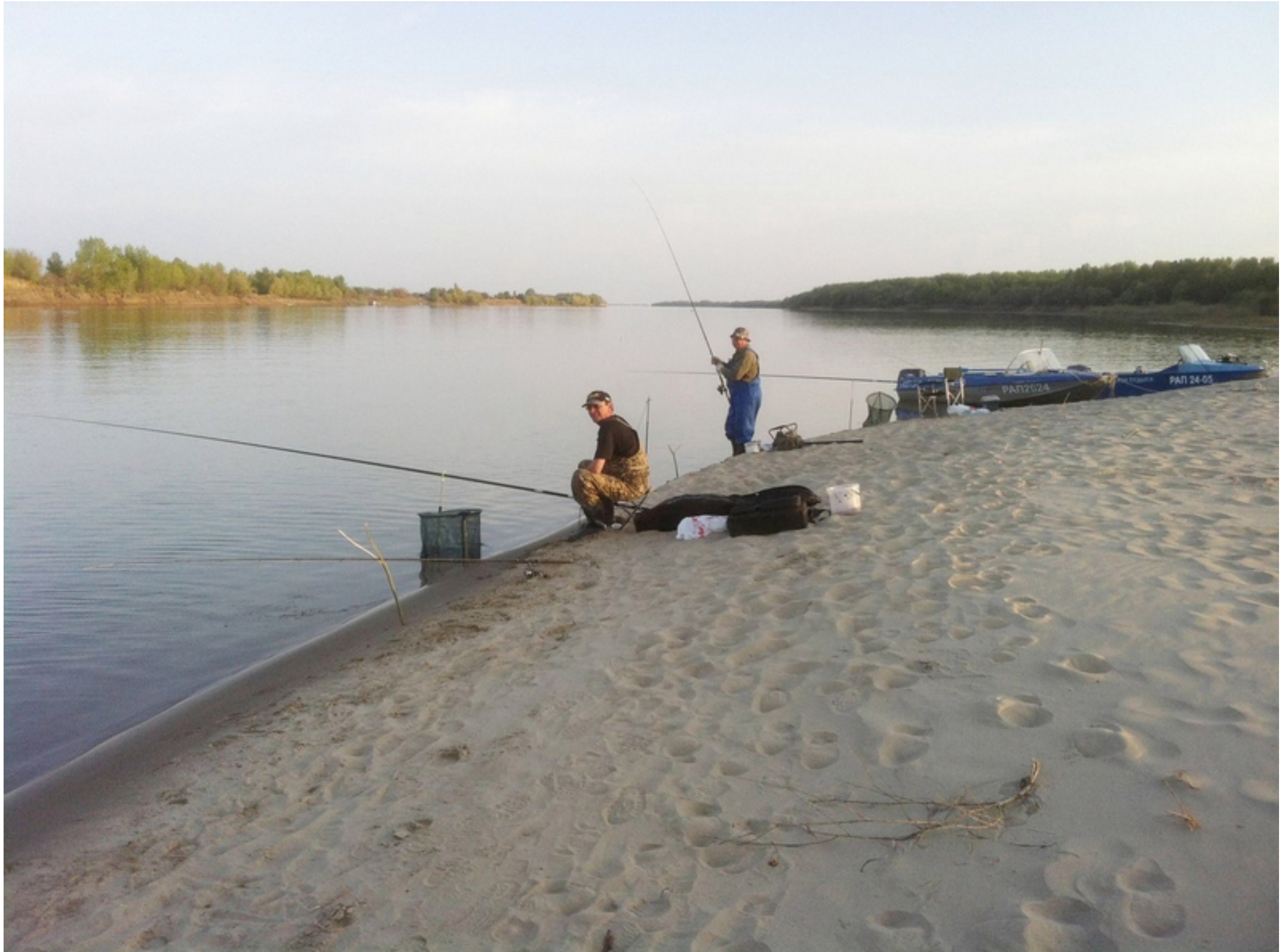
Вечерняя зорька продолжается