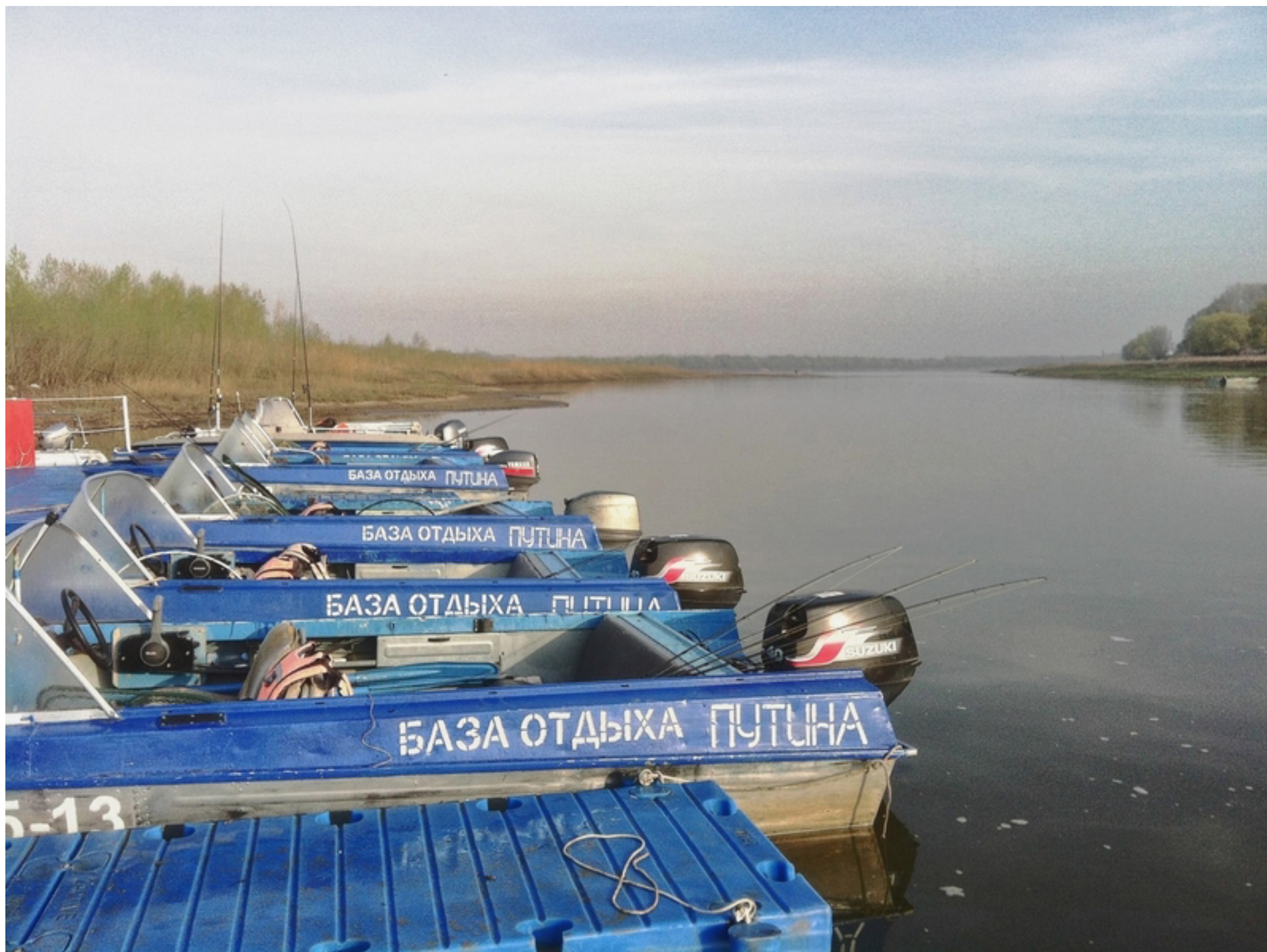
А это наш флот