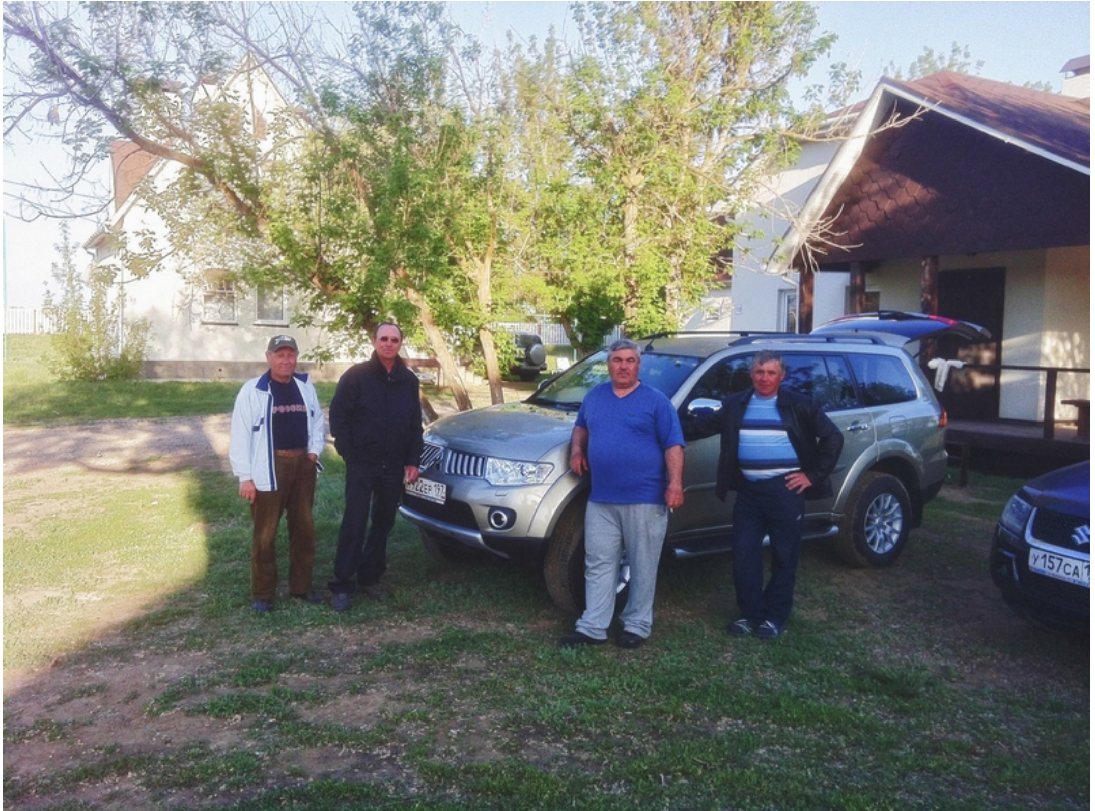
Уже почти всё собрали - скоро в Москву и Краснодар