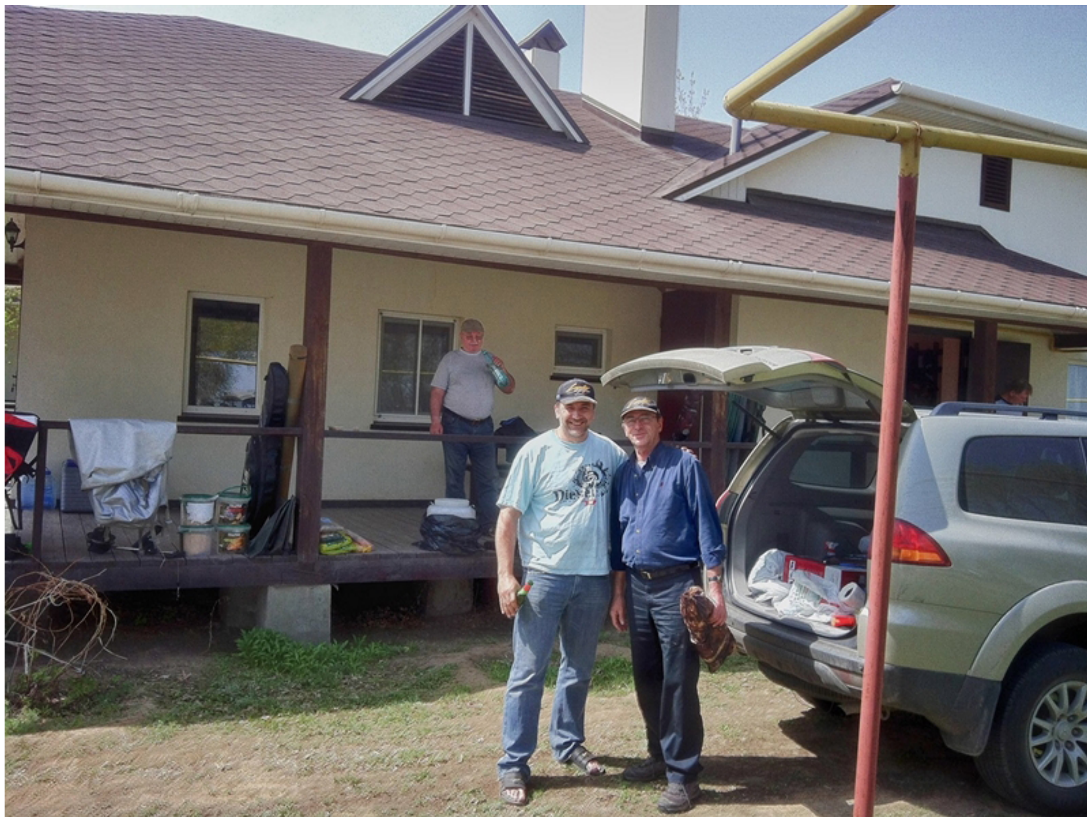
Прибыли на базу