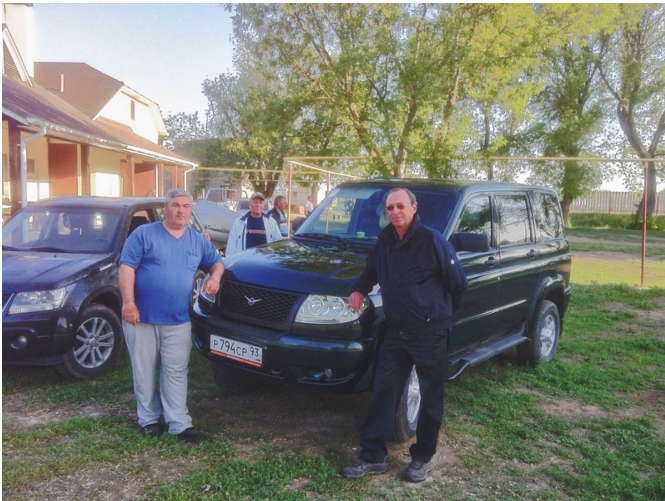
Наша экспедиция завершается - пора домой