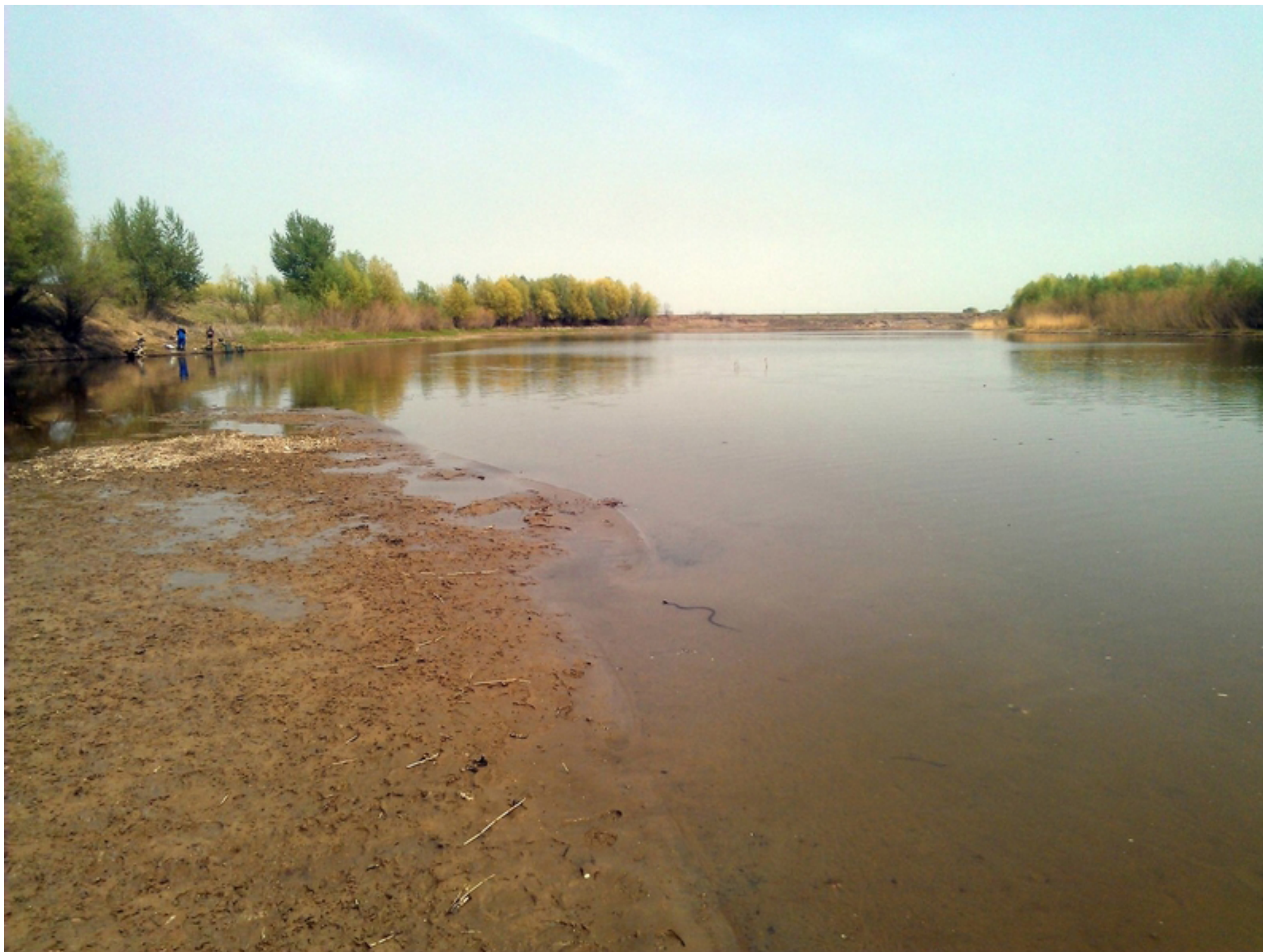
Одно из наших любимых мест лова на берегу ерика