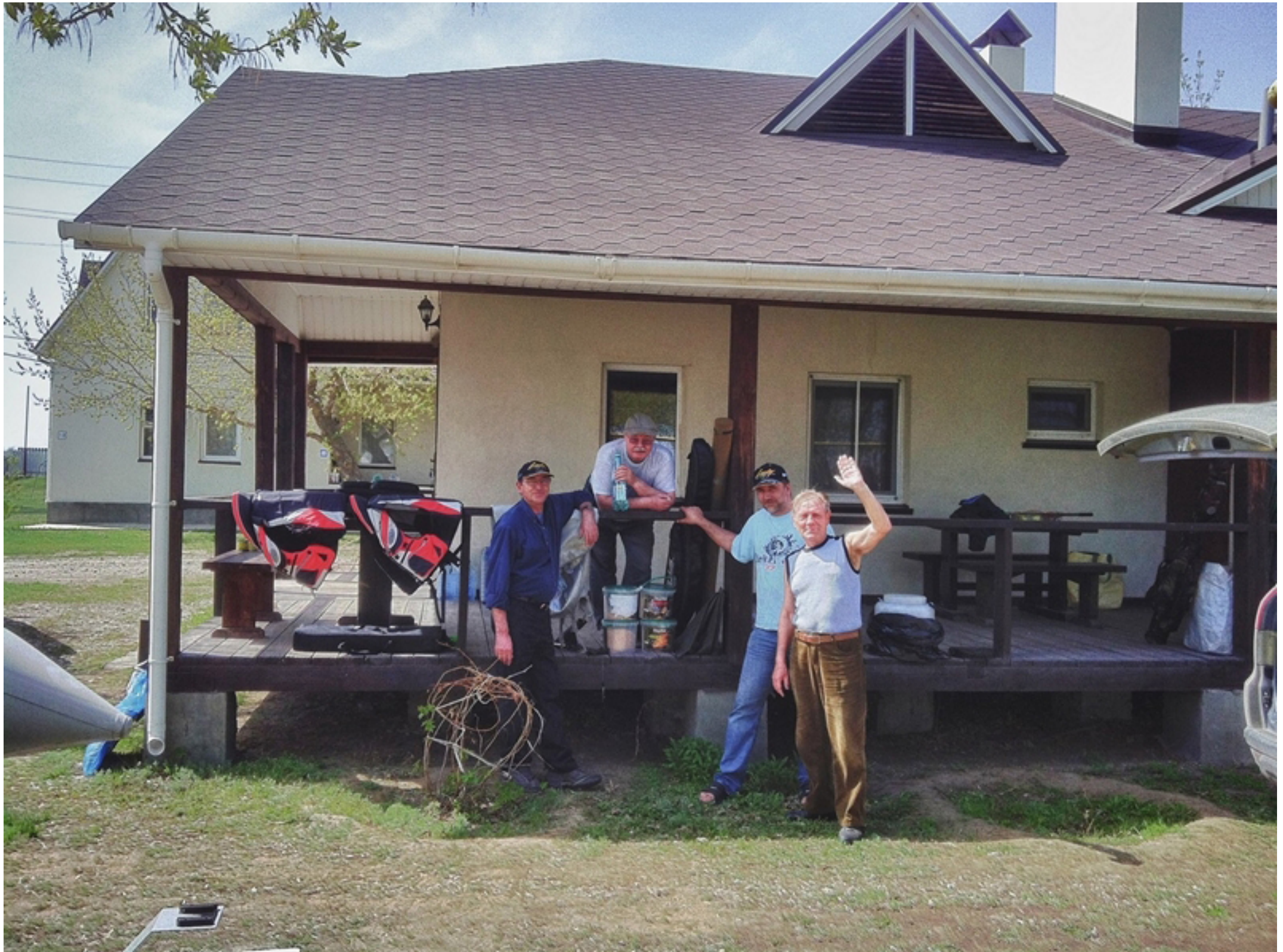
Разгрузили вещи и снасти