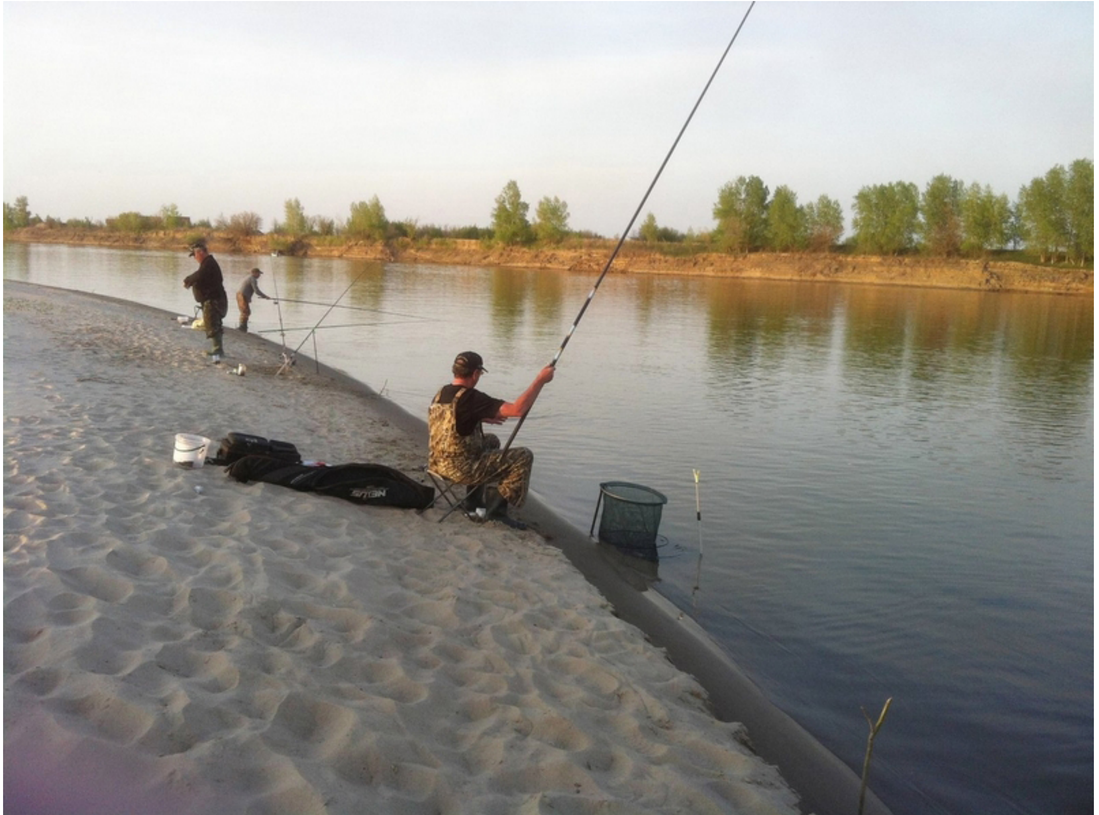
Все увлечены процессом рыбной ловли