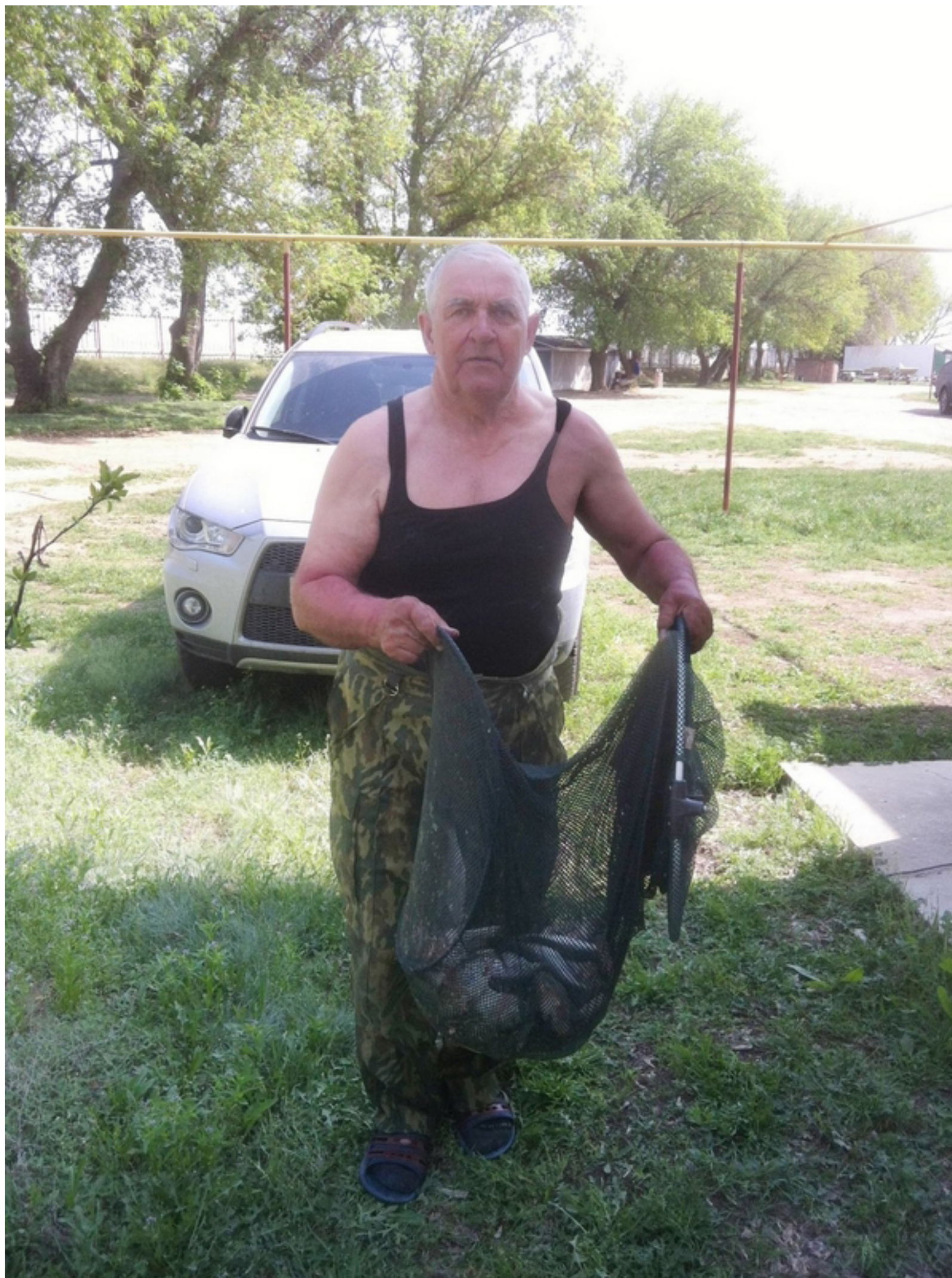
Михалыч лишен ложной скромности