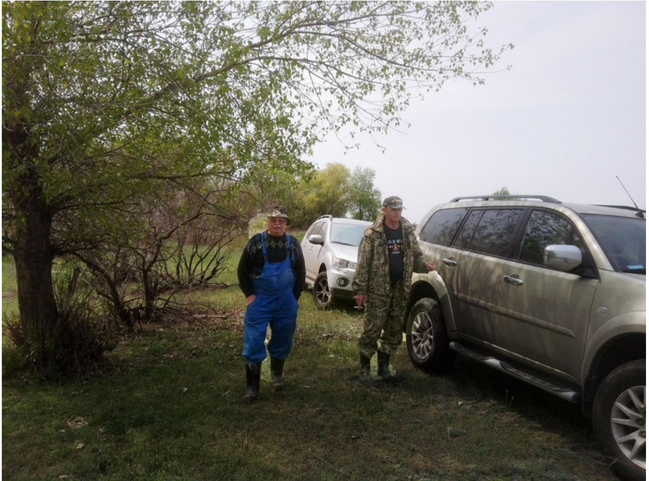
Приехали на ерик на машинах