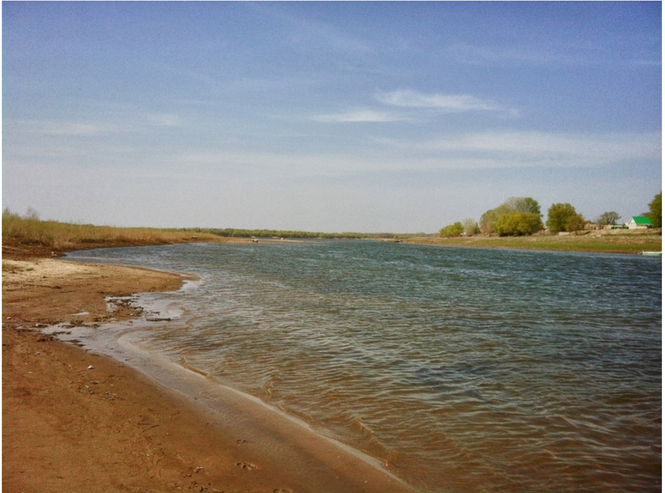
Ерик "Казачий" в месте соединения с Митинкой