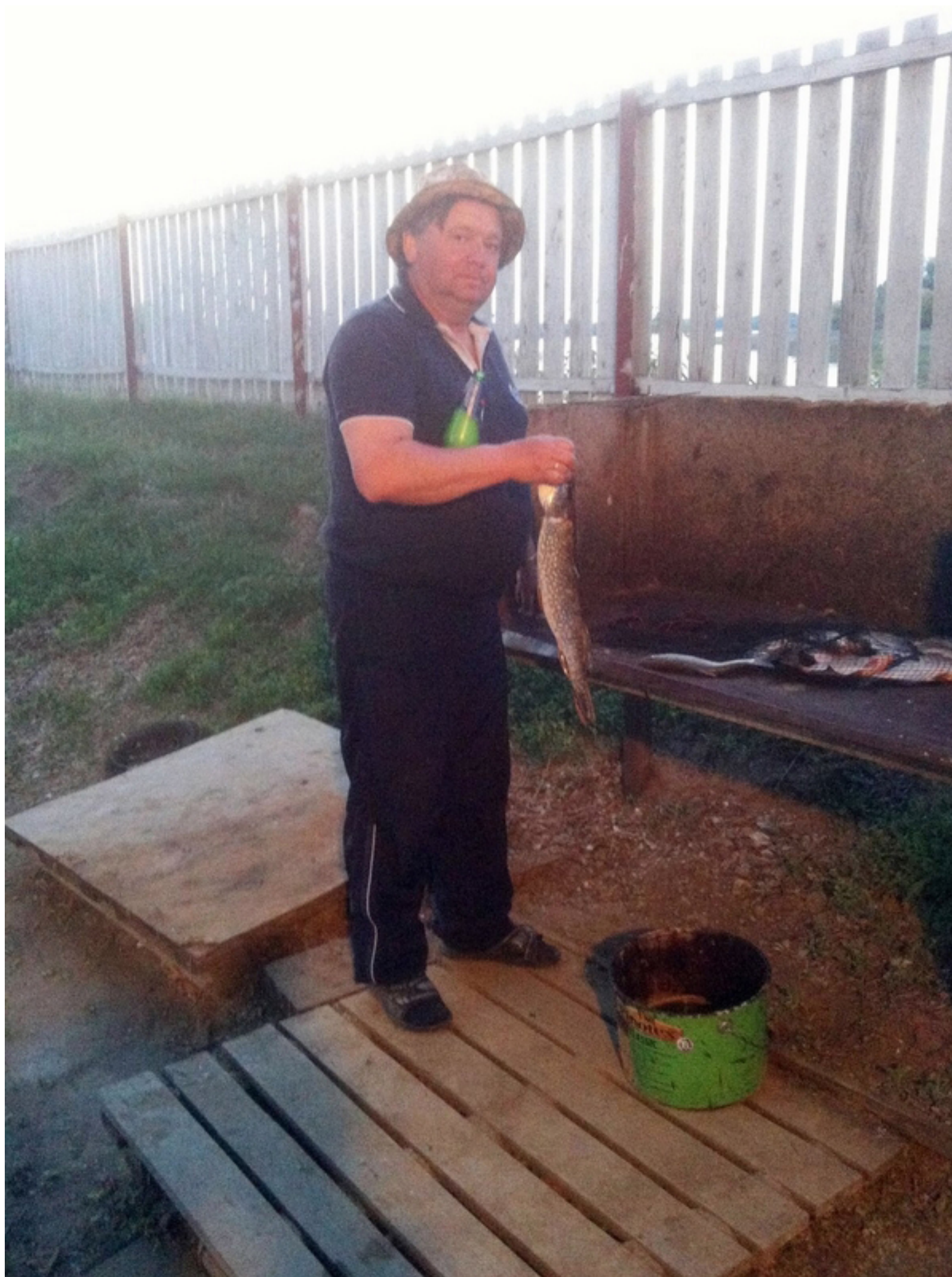
Александр Николаевич разбирается со своим уловом