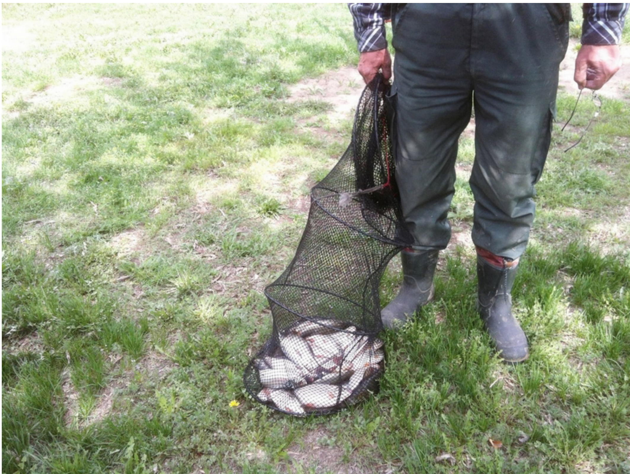
Тут не только вобла но и подлещик с плотвой