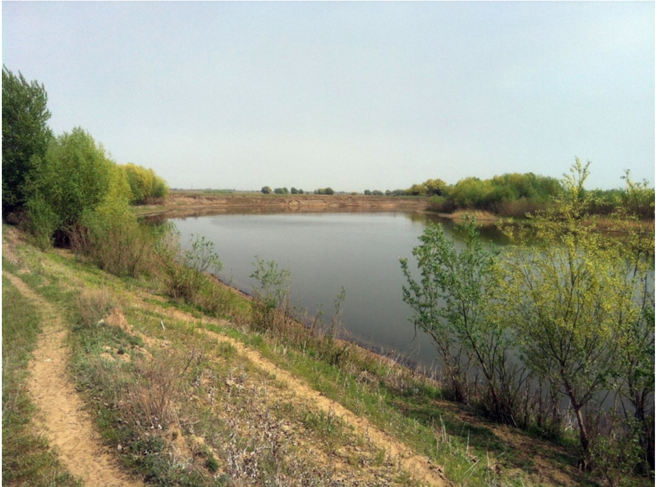
Одна из излучин ерика "Казачий"